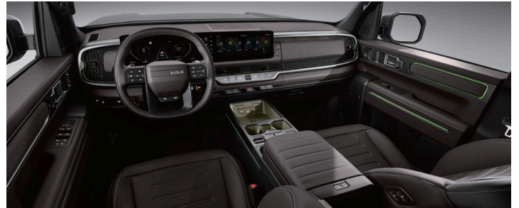
브라운 인테리어(에스프레소 브라운&오닉스 블랙)