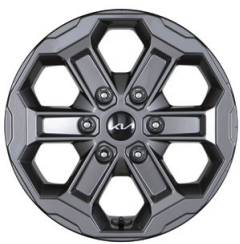
17인치 알루미늄 휠