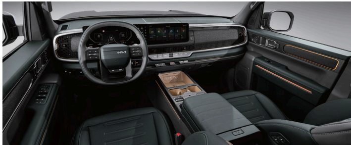
딥 그린 인테리어(딥 그린&미디엄 그레이)