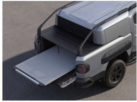
슬라이딩 베드(더블데커 적용 시)