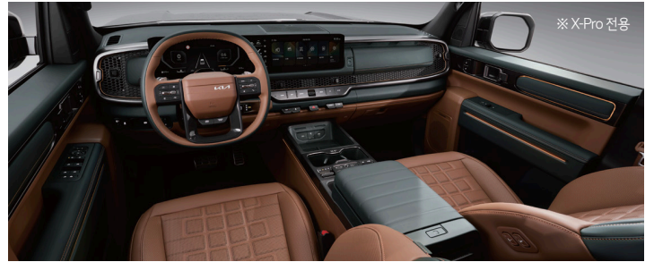
딥 그린&테라코타 브라운 인테리어