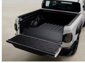
TPE 베드 매트