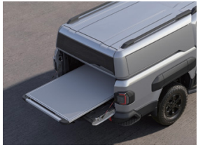
슬라이딩 베드(싱글데커 적용 시)