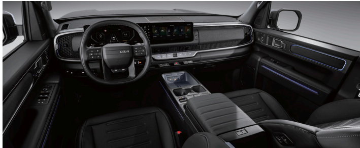
블랙 인테리어(오닉스 블랙&미디엄 그레이)

※ X-Pro는 딥 그린&테라코타 브라운 인테리어 및 블랙 인테리어 2종 선택 가능