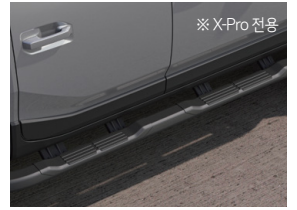
사이드 스텝(오프로드 스타일)