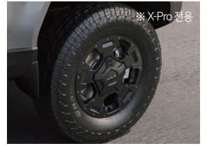
오프로드 스타일 휠