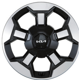
18인치 전면가공 휠