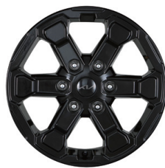
17인치 블랙 알루미늄 휠 (X-Pro 전용)