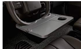
스티어링 휠 테이블