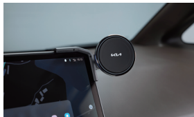
디스플레이 휴대폰 거치대