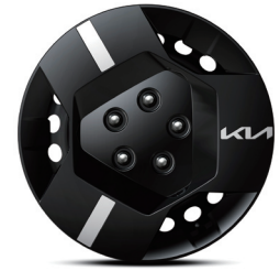
16인치 스틸 휠 (플사이즈 휠커버 적용)