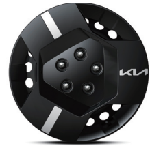
16인치 스틸 휠 (풀사이즈 휠커버 적용)