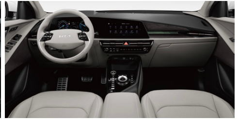
라이트 그레이 투톤 인테리어