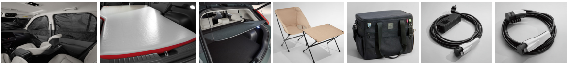
멀티 커튼 (전면/1열/2열) | 에어 매트 | 러기지 스크린 | 캠핑 의자 & 테이블 | 캠핑용 수납 가방 | 220V 휴대용 완속 충전 케이블 | 5핀 완속 충전 케이블