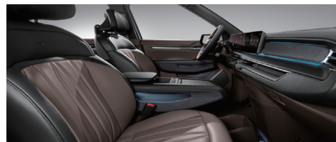
GT-line 전용 브라운 인테리어