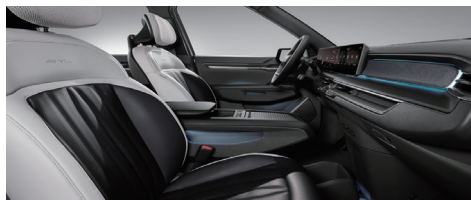
GT-line 전용 블랙&화이트 인테리어