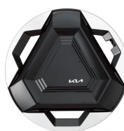
20인치 전면가공 휠