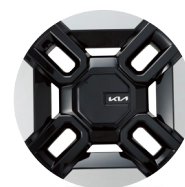
21인치 하이퍼 실버 휠