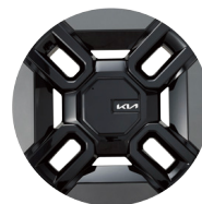
21인치 다크 실버 휠