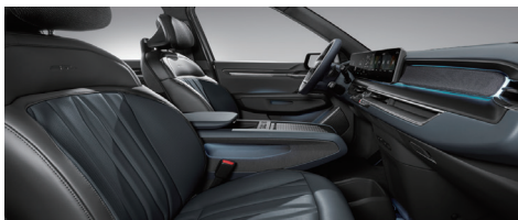
GT-line 전용 네이비 인테리어