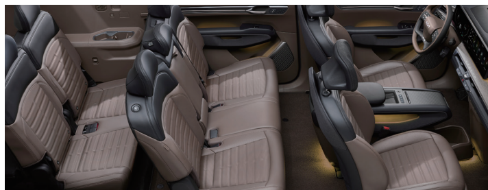
7인승 기본 시트