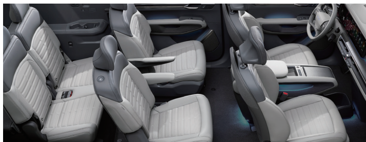
6인승 기본 시트