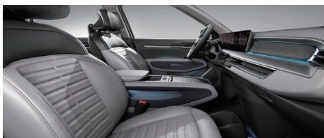
라이트 그레이 인테리어