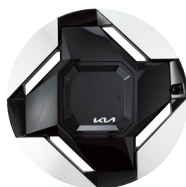
19인치 전면가공 휠