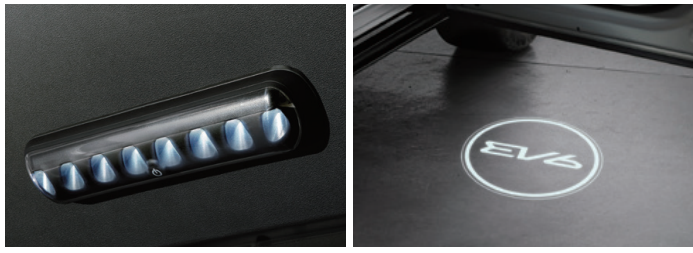
LED 테일게이트 램프 도어 스팟 램프