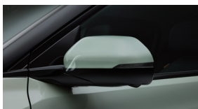
차량 보호 필름