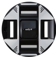
19인치 전면가공 휠