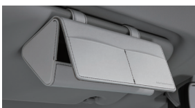
선바이지 선글라스 케이스