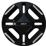
19인치 전면가공 휠 (GT-Line 전용)