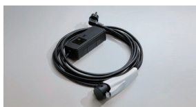
비상용 완속 충전 케이블(220V ICCB)