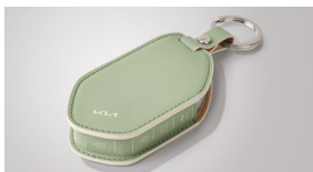
스마트키 가죽 케이스