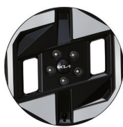
17인치 전면가공 휠