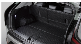
트렁크 폴커버 매트