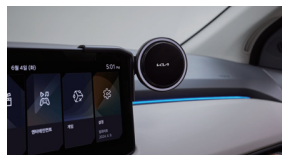
디스플레이 후미폰 거치대