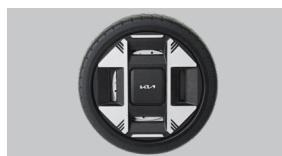
휠 디자인 디퓨저