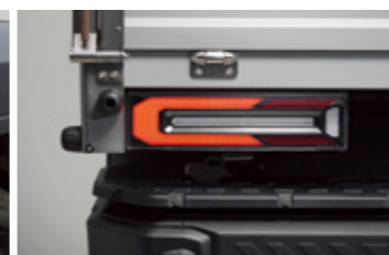
LED 리어 콤비네이션램프