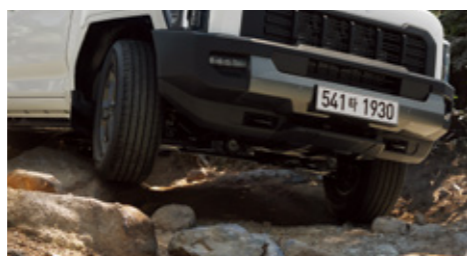
전자식 4WD / 터레인 모드 / LD