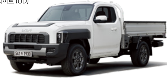
클리어 화이트 (UD)