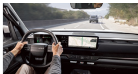
고속도로 주행 보조