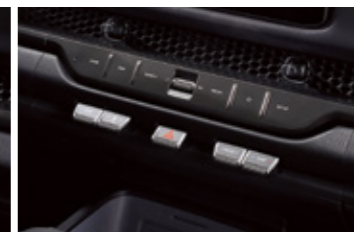
듀얼 풀오토 에어컨