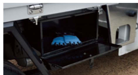
데크 하부 수납함