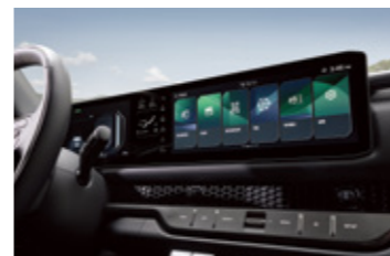
파노라믹 와이드 디스플레이