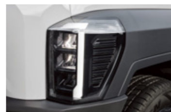
LED 헤드램프 (기본형)