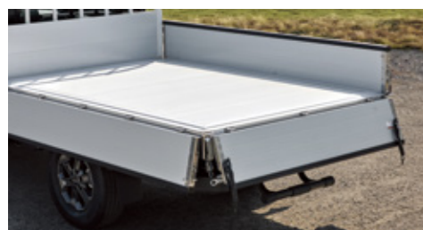
경량화 알루미늄 데크