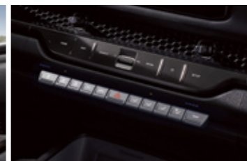
매뉴얼 에어컨 (기본형)