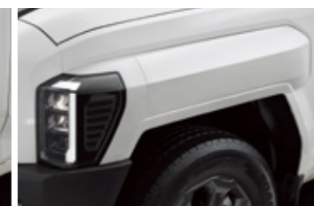
바디칼라 클래딩 ※클리어 화이트(UD) 단독 운영