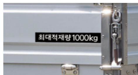
최대적재중량 1,000kg (2WD, 당사 자체 측정 기준) / 900kg (4WD)