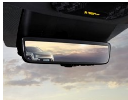
디지털 센터 미러