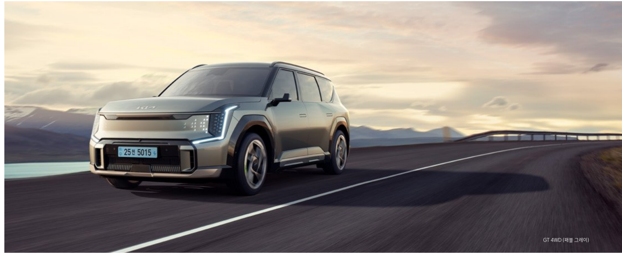
GT 4WD (매블 그레이)

기아 플래그십 전동화 SUV의 강력한 존재감에 고성능 감성을 더해, EV9 GT만의 혁신적인 스타일을 완성했습니다.