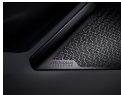
메리디안 프리미엄 사운드 (14스피커)