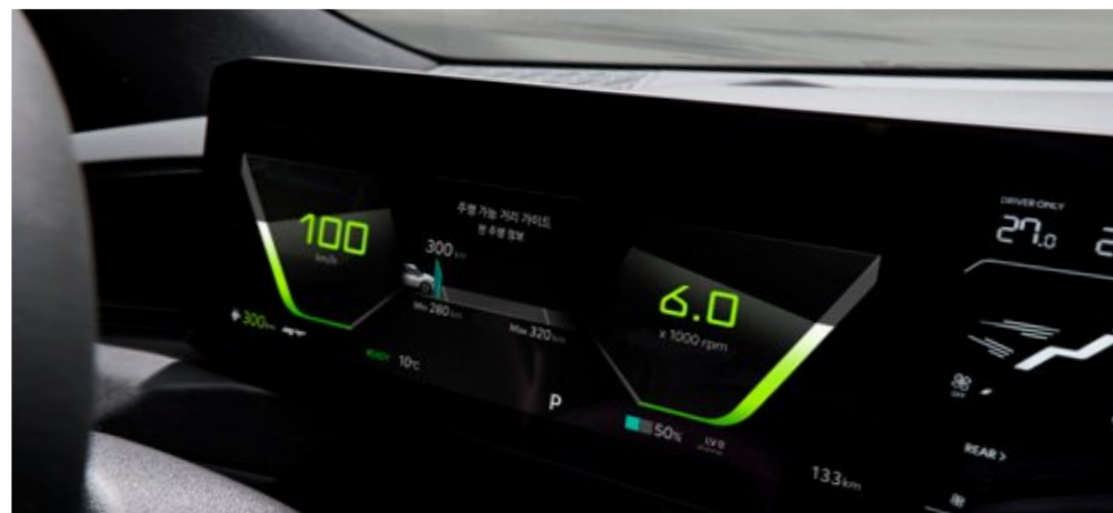
GT 전용 클러스터 / 가상변속시스템(VGS)

네온 컬러 포인트의 전용 클러스터 디자인과 내연 기관을 운전하는 듯한 가상의 변속감/사운드로 다이내믹하고 즐거운 주행 경험을 제공합니다.