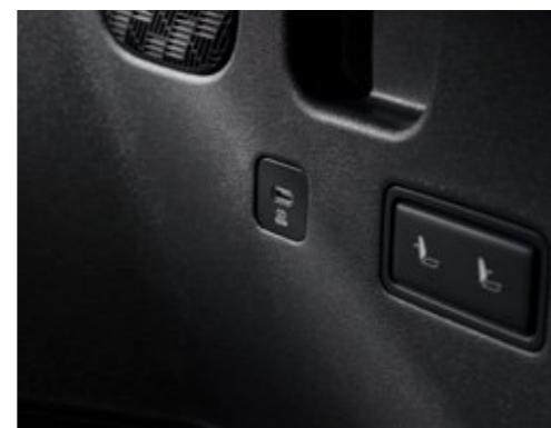
100W C 타입 USB 단자