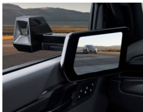
디지털 사이드 미러