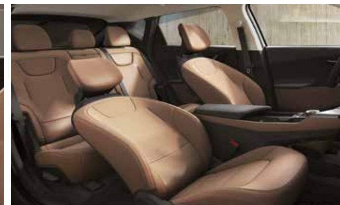
앞좌석 릴렉션 콤포트 시트