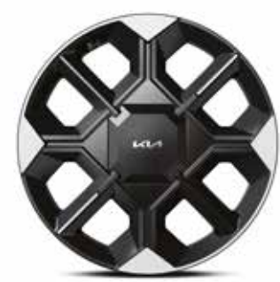
20인치 전면가공 휠