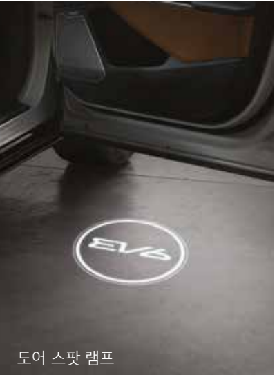
도어 스팟 램프