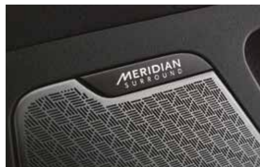
메리디언 프리미엄 사운드 (14스피커, 외장앰프)