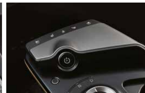
센터 콘솔 터치 스위치