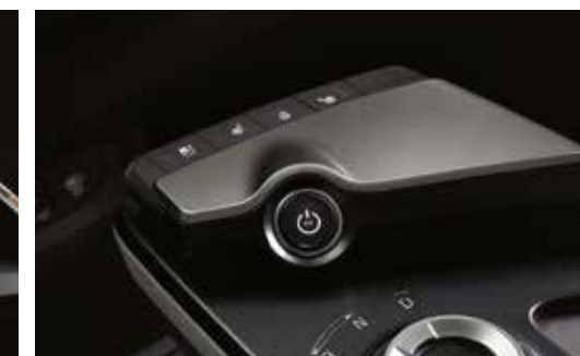
센터 콘솔 버튼식 스위치