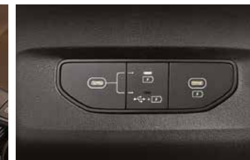
데이터/충전 전환형 USB 단자