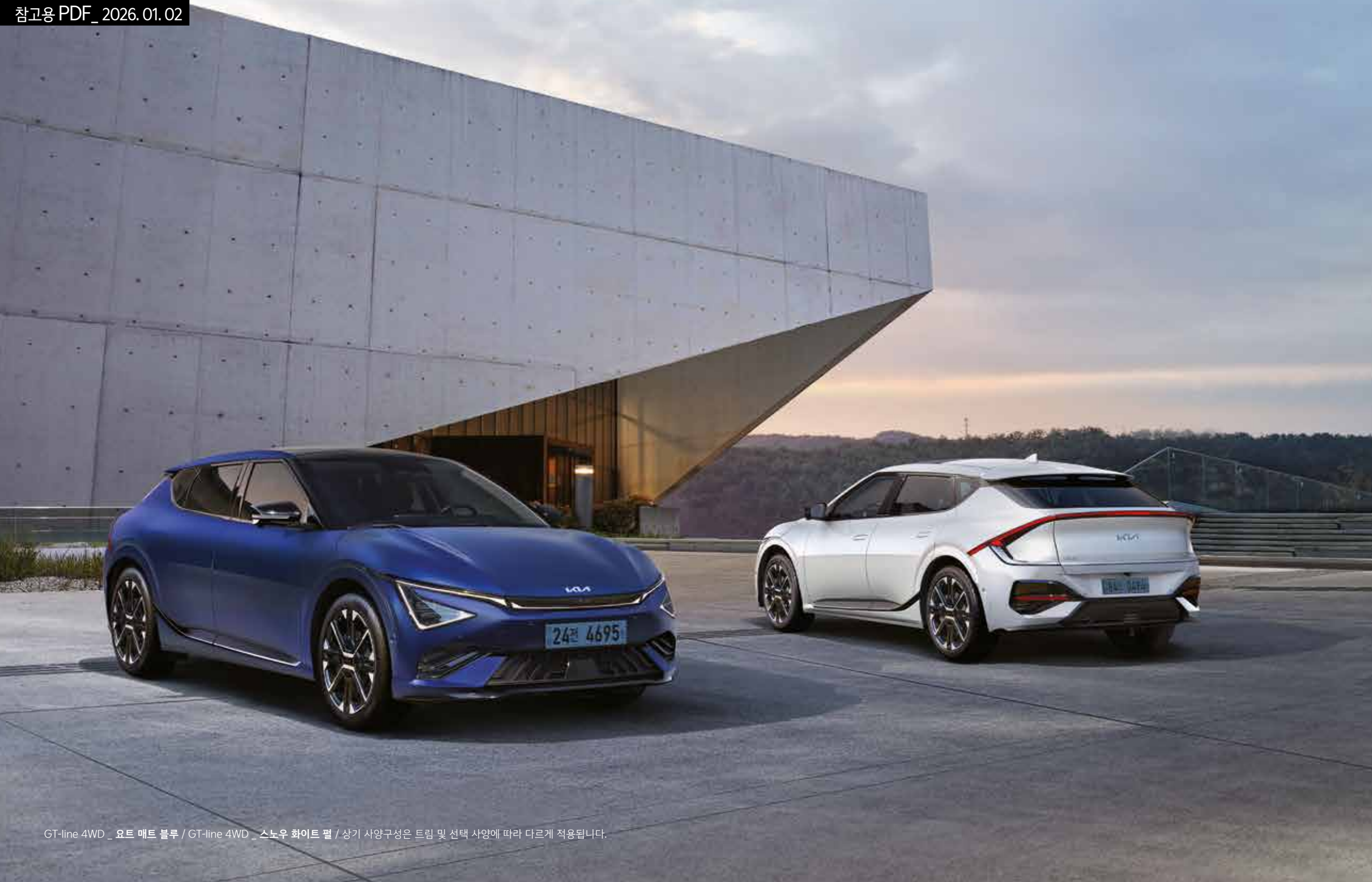
GT-line 4WD _ 요트 매트 블루 / GT-line 4WD _ 스노우 화이트 펄 / 상기 사양구성은 트림 및 선택 사양에 따라 다르게 적용됩니다.