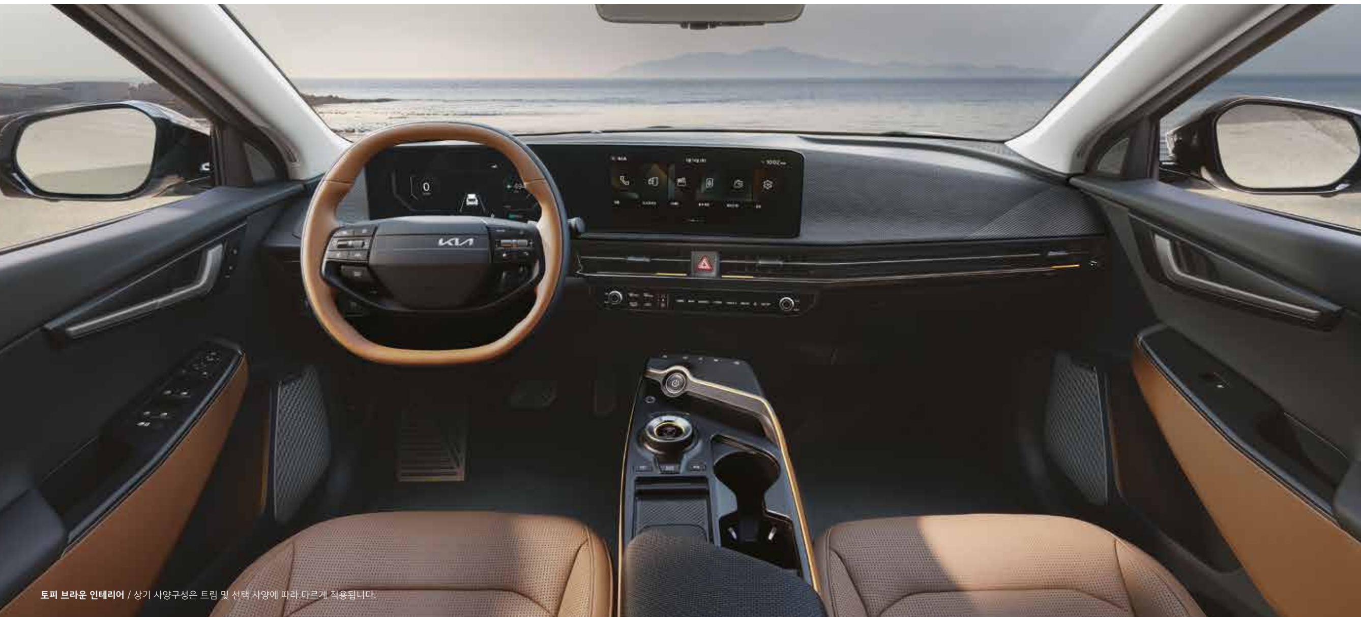
토피 브라운 인테리어 / 상기 사양구성은 트림 및 선택 사양에 따라 다르게 적용됩니다.