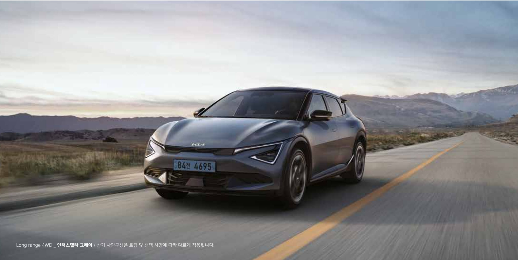
Long range 4WD _ 인터스텔라 그레이 / 상기 사양구성은 트림 및 선택 사양에 따라 다르게 적용됩니다.