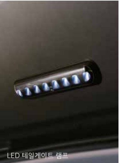
LED 테일게이트 램프