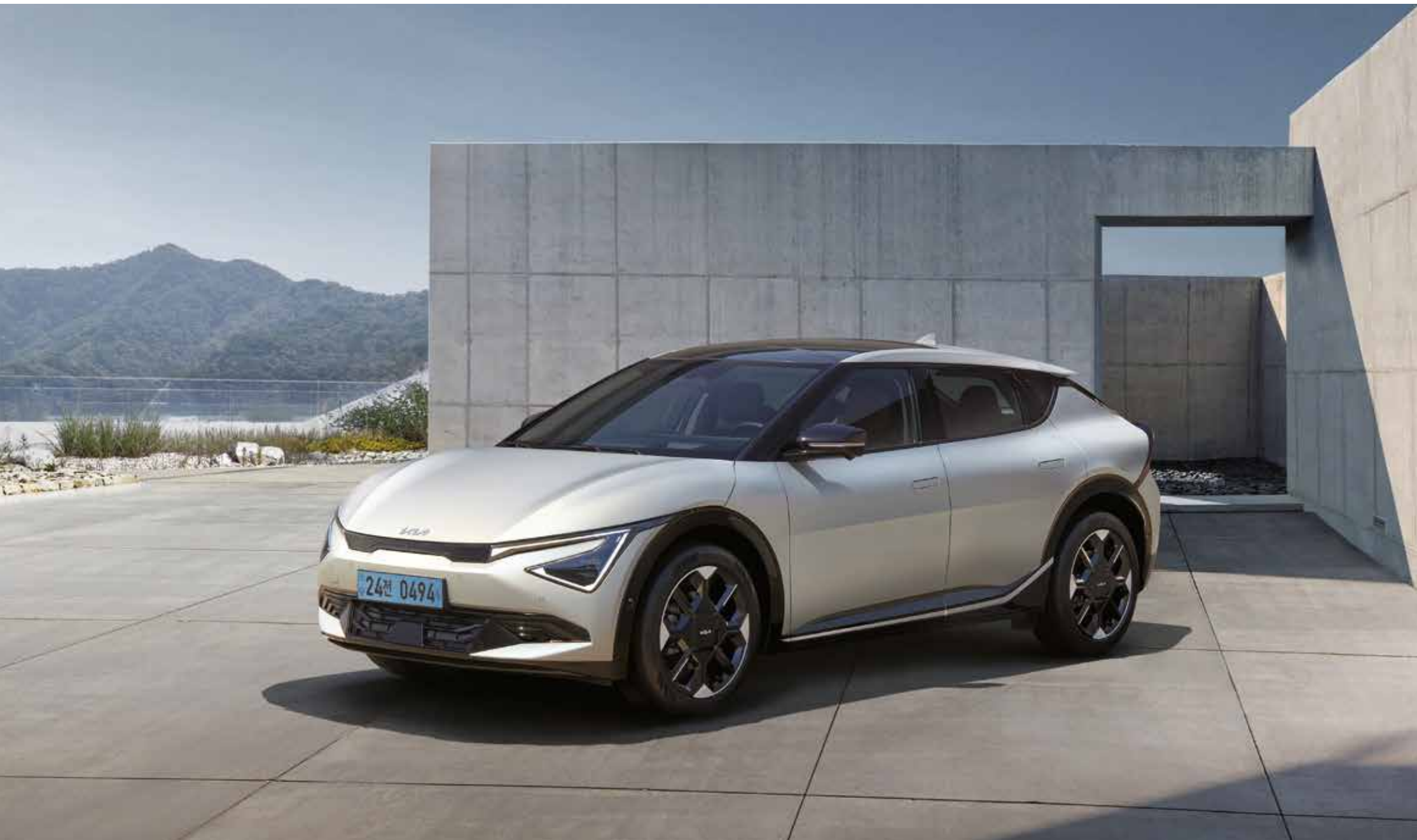
Long range 4WD _ 아이보리 매트 실버 / 상기 사양구성은 트림 및 선택 사양에 따라 다르게 적용됩니다.