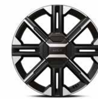
20인치 전면가공 휠 (GT-line 전용)