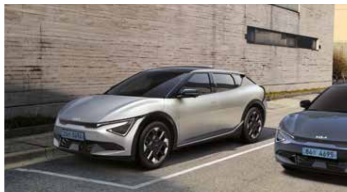
전방/측방/후방 주차 충돌방지 보조

주차/출차 시 보행자나 물체와의 충돌 위험이 감지되면 자동으로 제동을 도와줍니다.