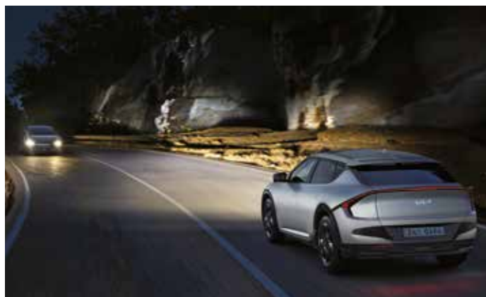
지능형 헤드램프 (IFS)