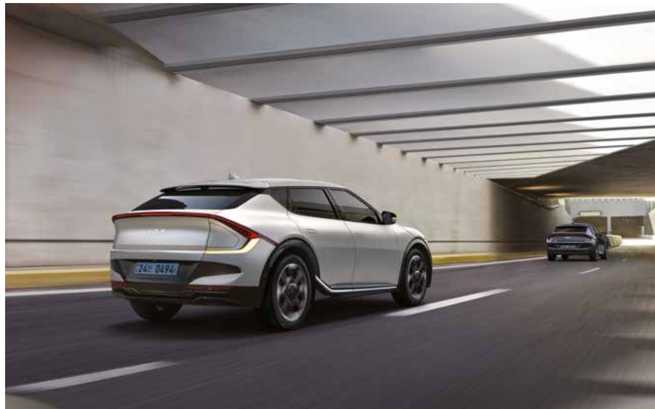
고속도로 주행 보조 2(차로 변경 보조 제어 기능 포함)

기아의 첨단 운전자 보조 시스템이 다양한 주행과 주차 상황에서 운전자의 안전과 편의를 도와줍니다.