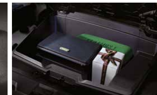
프론트 트렁크 (2WD)