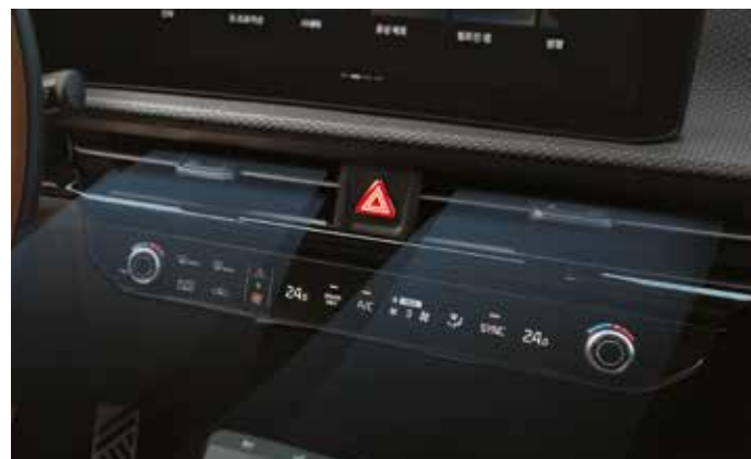
에어컨 광촉매 살균 시스템*