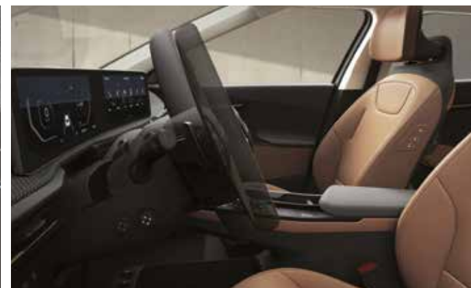
전동식 틸트&텔레스코픽 스티어링 휠*