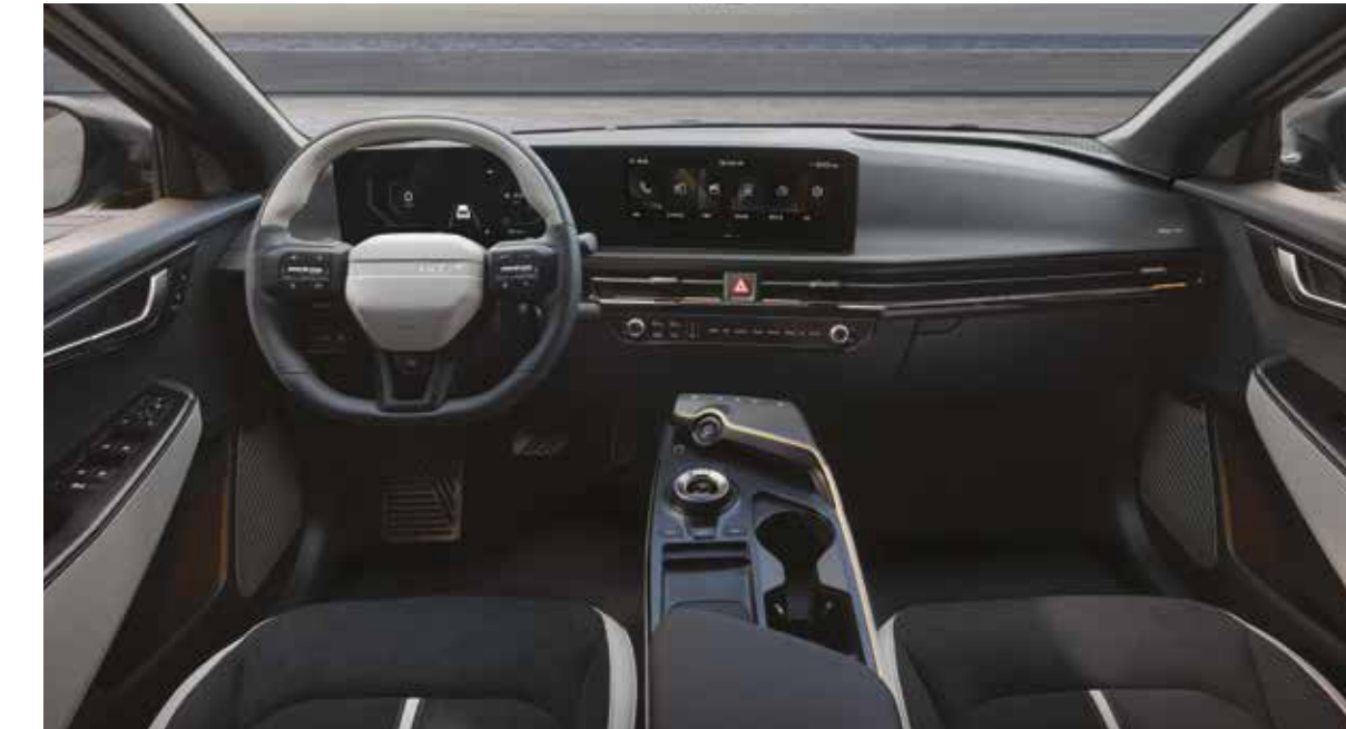
GT-line 내장 디자인

전용 범퍼와 휠, 바디 컬러와 통일된 휠 클래딩, 프론트 LED 센터 포지셔닝 램프 등 GT-line만의 아이덴티티를 선보입니다.