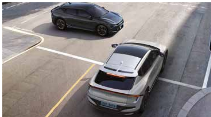
후측방 충돌방지 보조

차로 변경을 위해 방향지시등 조작 시, 후측방 차량과 충돌 위험이 감지되면 경고를 해줍니다. 평행 주차 상태에서 전진 출차 중 후측방 차량과 충돌 위험이 감지되면 자동으로 제동을 도와줍니다.