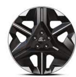
19인치 전면가공 휠