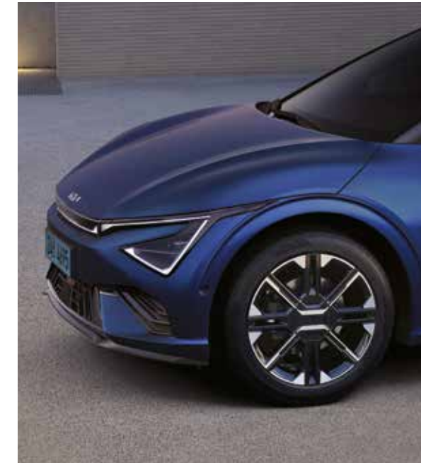
GT-line 외장 디자인

전용 범퍼와 휠, 바디 컬러와 통일된 휠 클래딩, 프론트 LED 센터 포지셔닝 램프 등 GT-line만의 아이덴티티를 선보입니다.