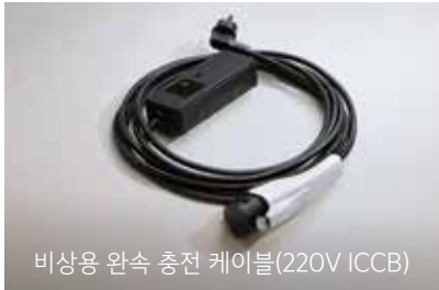
비상용 완속 충전 케이블(220V ICCB)