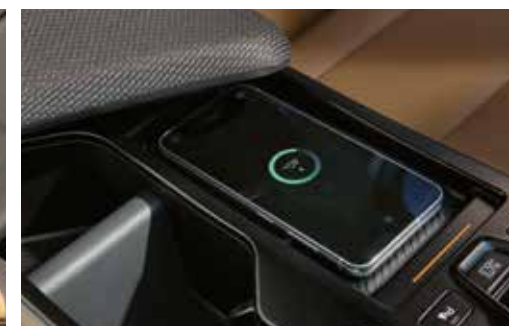
스마트폰 무선충전 시스템