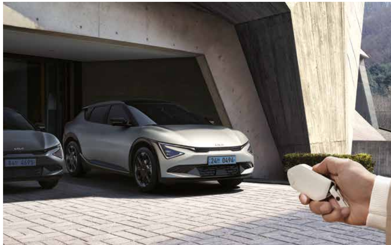
원격 스마트 주차 보조 2

선행 차량이 갑자기 속도를 줄이거나 전방에 정지 차량, 보행자, 자전거 탑승자가 나타나는 등 전방 충돌 위험이 높아질 경우 경고를 해주고 필요에 따라 자동으로 제동을 도와줍니다. 또한, 주행 중 교차로에서 좌회전 시 맞은편에서 다가오는 차량과 충돌 위험이 있다면 자동으로 제동을 도와줍니다.