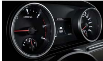
슈퍼비전 클러스터 (4.2인치 칼라 TFT LCD)