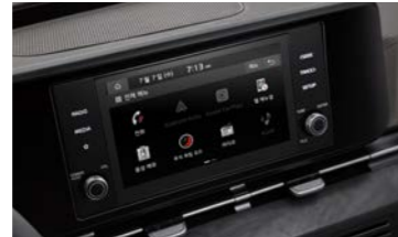
8인치 디스플레이 오디오