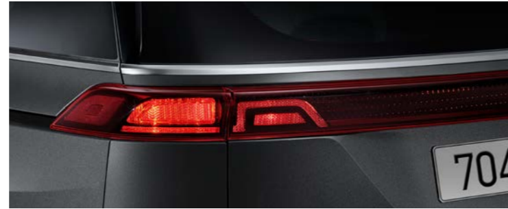
기본형 리어 콤비네이션램프