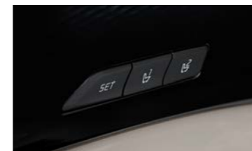
운전자세 메모리 시스템 (운전석 시트, 아웃사이드 미러)