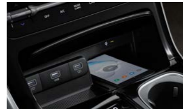
스마트폰 무선충전 시스템