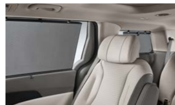
2/3열 측면 수동 섀터