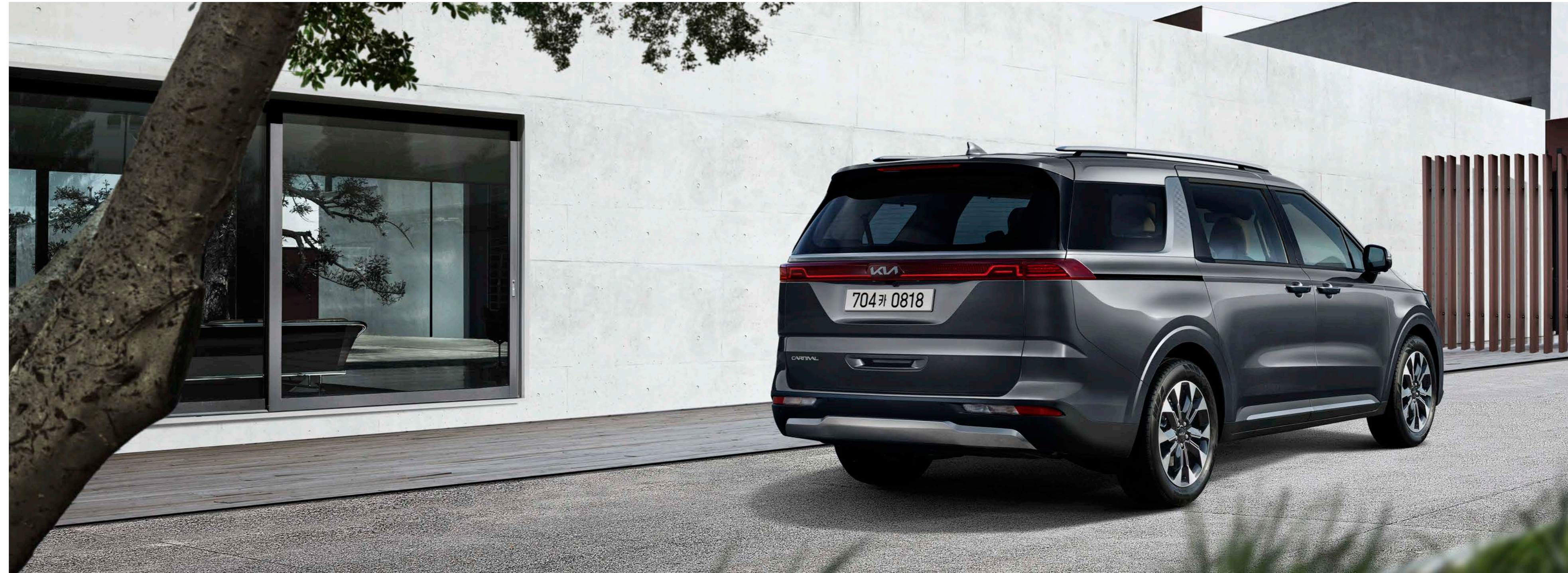
판테라 메탈 (P2M) 상기 사양구성은 트림, 인승 모델별, 엔진, 선택 사양에 따라 다르게 적용됩니다