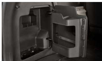
도어타입 러기지 트레이 (7인승 운영)