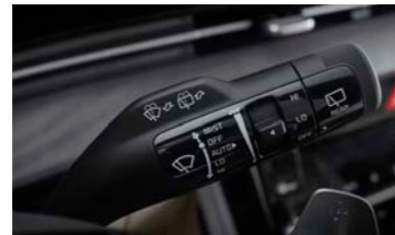
레인센서 (우적감지 와이퍼)