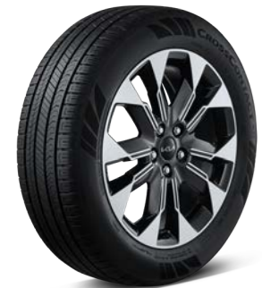
19인치 전면가공 휠