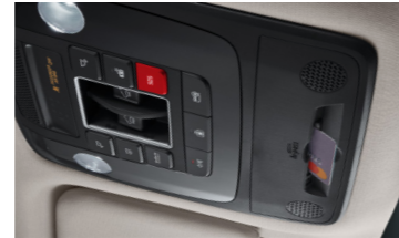
하이패스 자동 결제 시스템