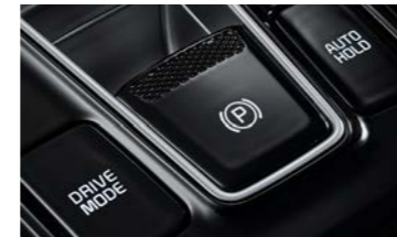
전자식 파킹브레이크 (오토홀드 포함)