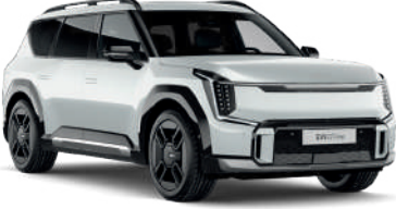
Snow Pearl Beyaz (SWP)