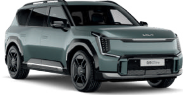
Iceberg Yeşil (IEG)

Distribütör firma, önceden bildirmeksizin model, teknik özellik, ekipman ve aksesuar değişikliği yapma hakkını saklı tutar. Bu doküman basım tarihinden sonra güncellenmiş olabilir. Kullanılan görsel, mevcut araçtan farklılık gösterebilir. Bu broşürde yer alan bazı özellikler standart modelde bulunmayabilir. Araçla ilgili teknik veriler, homologasyon test raporu, kullanım kılavuzu, bakım kitapçığı ve üretici firma broşürlerinden alınmıştır. Testlerde kullanılan araçlar standart donanımdır; opsiyonel donanım ve aksesuarlar, jantlar ve lastikler yakıt tüketimini etkileyebilir. Kia binek aracınız, 2 yıl ya da 60.000 km yasal garanti kapsamındadır. Anahtar teslim tarihinden itibaren, aracınız toplamda 5 yıl veya 150.000 km boyunca Kia Özel Garanti Onarım Güvencesi ile güvence altına alınmaktadır. (AB) 2020/740 yönetmeliği kapsamında, lastiklerin yakıt verimliliği ve diğer parametrelerine ilişkin bilgiler web sitemizde yer almaktadır. Detaylı bilgi için www.kia.com.tr adresini ziyaret edebilirsiniz. Belirtilen lastiklerle ilgili bilgiler yalnızca bilgi amaçlıdır. Tabloda belirtilen donanım özellikleri 2025 model yılı ve Şubat 2026 tarihinden itibaren satışa sunulan araçlar için geçerlidir. Basım hatalarından distribütör firma sorumlu değildir.