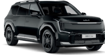
Aurora Pearl Siyah (ABP)