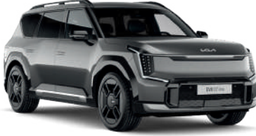
Pebble Gri (DFG)