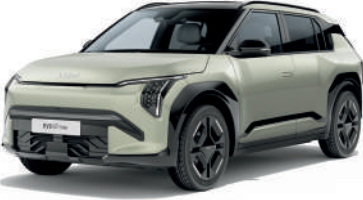
Aventurine Yeşil (AG3)