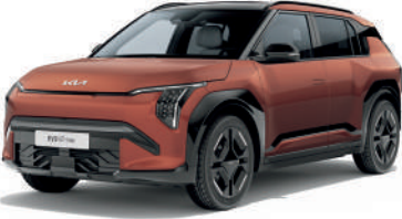
Terra Cotta Kırmızı (TCT)