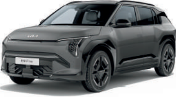
Shale Gri (EBD)