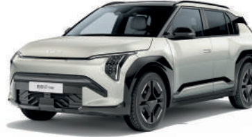
Ivory Gri (Metalik) (İSG)