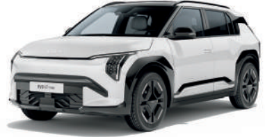
İnci Beyaz (UD)

Distribütör firma, önceden bildirmeksizin model, teknik özellik, ekipman ve aksesuar değişikliği yapma hakkını saklı tutar. Bu doküman basım tarihinden sonra güncellenmiş olabilir. Kullanılan görsel, mevcut araçtan farklılık gösterebilir. Bu broşürde yer alan bazı özellikler standart modelde bulunmayabilir. Araçla ilgili teknik veriler, homologasyon test raporu, kullanım kılavuzu, bakım kitapçığı ve üretici firma broşürlerinden alınmıştır. Testlerde kullanılan araçlar standart donanımlıdır; opsiyonel donanım ve aksesuarlar, jantlar ve lastikler yakıt tüketimini etkileyebilir. Kia binek aracınız, 2 yıl ya da 60.000 km yasal garanti kapsamındadır. Anahtar teslim tarihinden itibaren, aracınız toplamda 5 yıl veya 150.000 km boyunca Kia Özel Garanti Onarım Güvencesi ile güvence altına alınmaktadır. (AB) 2020/740 yönetmeliği kapsamında, lastiklerin yakıt verimliliği ve diğer parametrelerine ilişkin bilgiler web sitemizde yer almaktadır. Detaylı bilgi için www.kia.com.tr adresini ziyaret edebilirsiniz. Belirtilen lastiklerle ilgili bilgiler yalnızca bilgi amaçlıdır. Tabloda belirtilen donanım özellikleri 2025 model yılı ve Şubat 2026 tarihinden itibaren satışa sunulan araçlar için geçerlidir. Basım hatalarından distribütör firma sorumlu değildir.