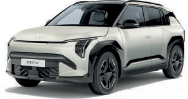
Ivory Gri (Mat) (İSM)