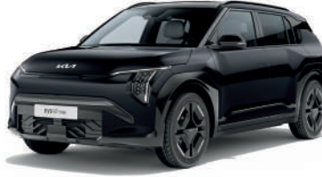
Aurora Pearl Siyah (ABP)