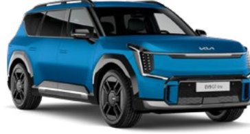
Ocean Mavi Mat (OBM)