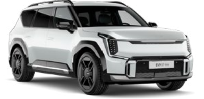
Snow Pearl Beyaz (SWP)