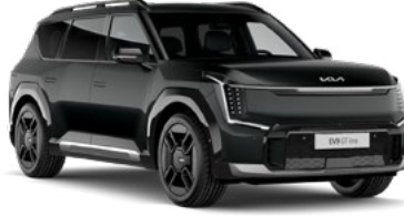
Aurora Pearl Siyah (ABP)