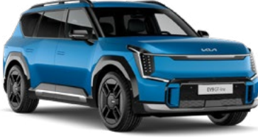
Ocean Mavi Metalik (OBG)