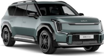
Iceberg Yeşil (IEG)