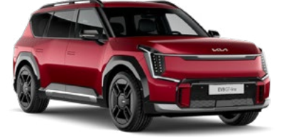
Flare Kırmızı (C7R)