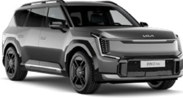
Pebble Gri (DFG)