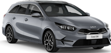
Aytaşı Gri (CSS)