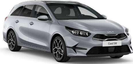
Gümüş Gri (KCS)