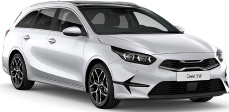
İnci Beyaz (HW2)