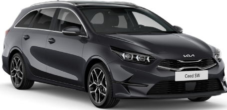
Fırtına Gri (H8G)