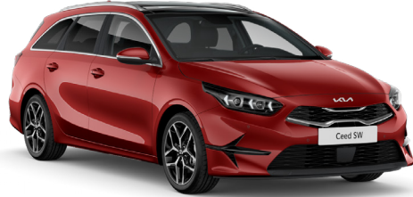
Manyetik Kırmızı (AA9)