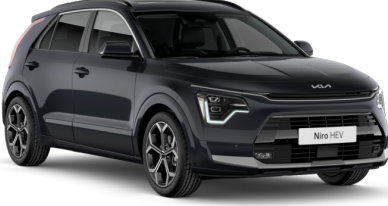
Aurora Pearl Siyah (ABP)