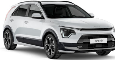
Snow Pearl Beyaz (SWP)