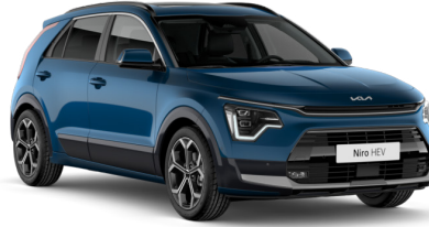
Mineral Mavi (M4B)