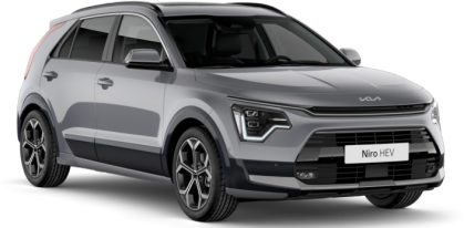
Steel Gri (KLG)