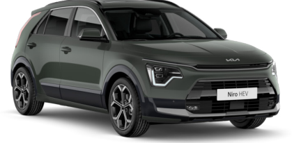
Cityscape Yeşil (CGE)