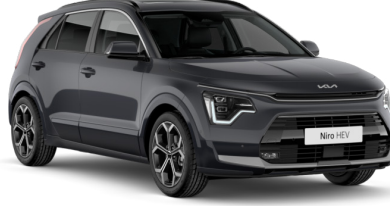
Interstellar Gri (AGT)