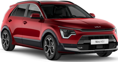
Runway Kırmızı (CR5)