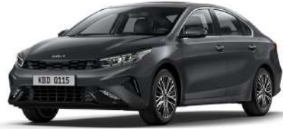
Platinum Gri (ABT)