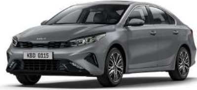
Steel Gri (KLG)