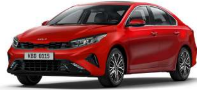
Runway Kırmızı (CR5)