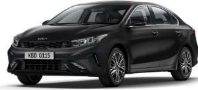
Aurora Pearl Siyah (ABP)