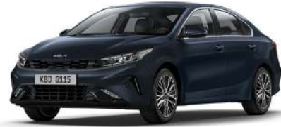
Gravity Mavi (B4U)