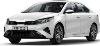
Snow Pearl Beyaz (SWP)