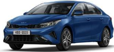
Mineral Mavi (M4B)