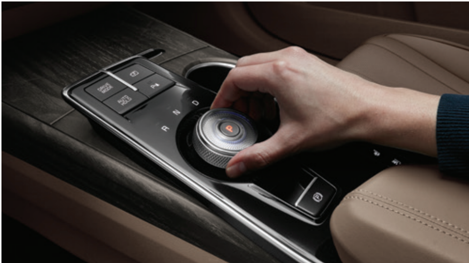
تطعيمات خشبية فاخرة ونظام إضاءة محيطية