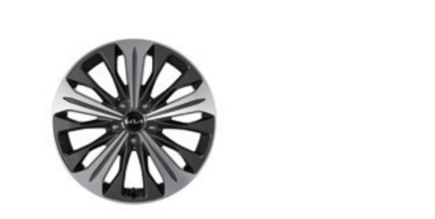
عجلة مصنوعة من سبائك الألومنيوم مقاس 18 بوصة