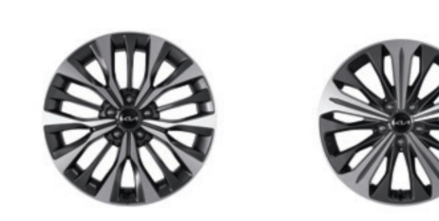
عجلة مصنوعة من سبائك الألومنيوم مقاس 19 بوصة