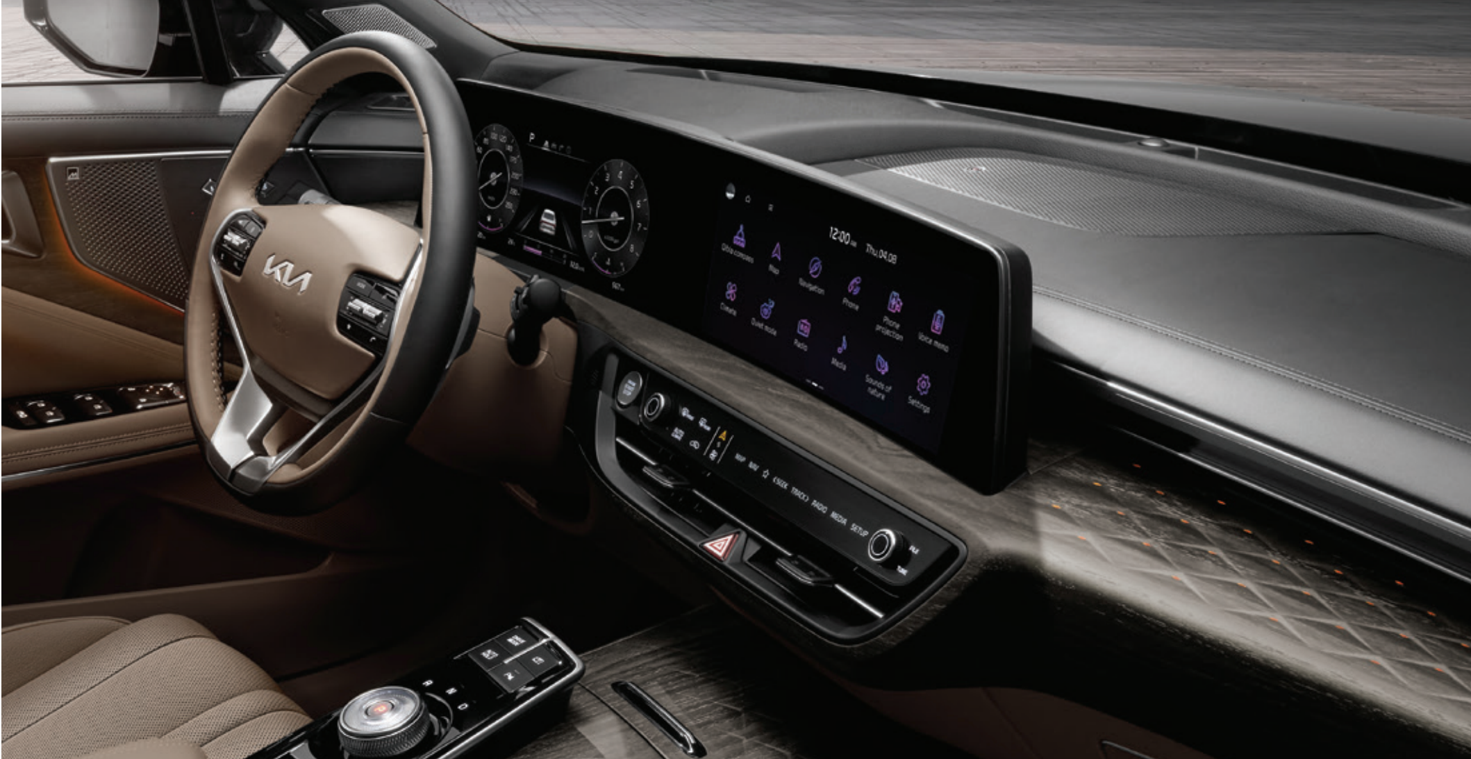
شاشة بانورامية منحنية

لقد حظت السيارة كيا K8 بوسائل تحسين مميزة تضمنت الخشب المصقول والجلد الناعم المنقوش ولحسات الكروم الادمع.