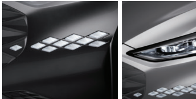
مصابيح LED نهارية / إشارات انعطاف LED