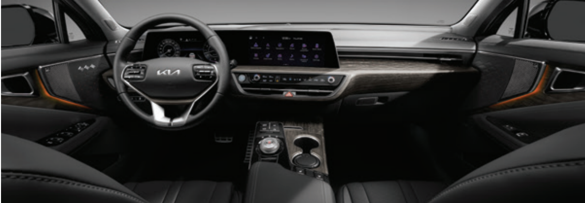
أسود ساترن بدرجة واحدة