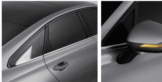
زخرفة من الكروم