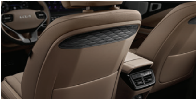
جيب في ظهر المقاعد (نوع لوحي)