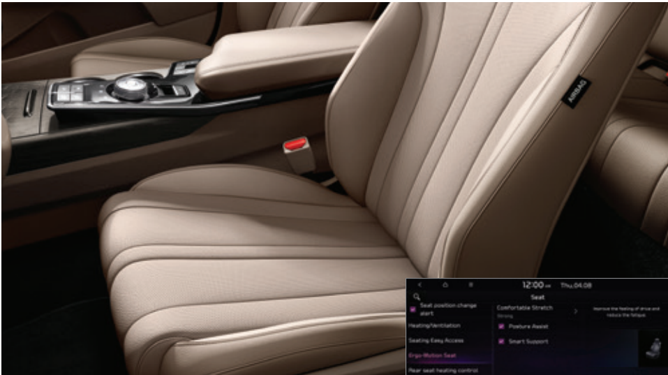
مقاعد جلد فاخرة