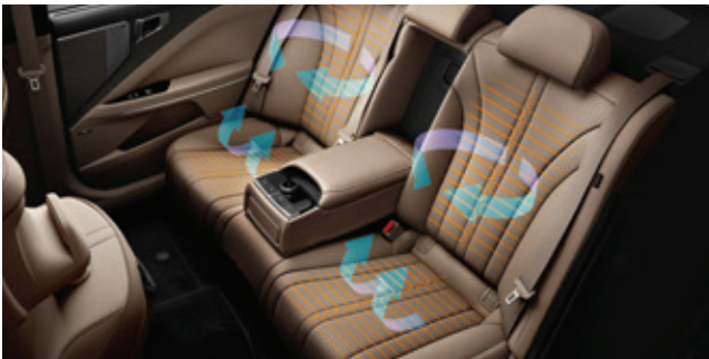
نظام تهوية / تدفئة المقاعد (جميع المقاعد)