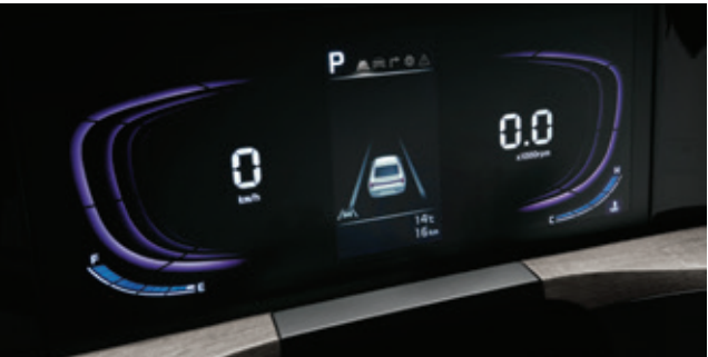
لوحة المراقبة الرقمية (شاشة TFT LCD ملونة مقاس 4.2 بوصة)