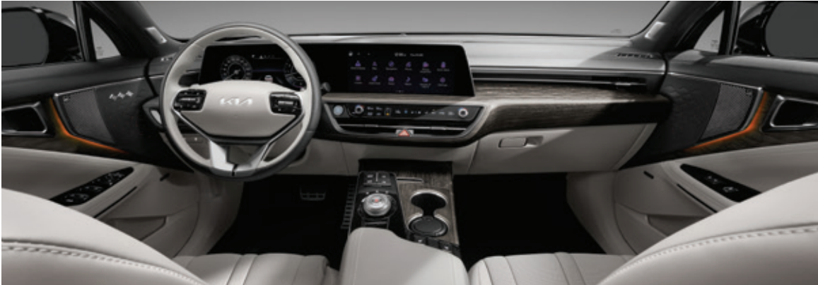
بيج رملي بدرجتين