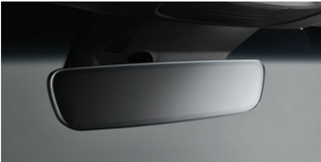
مرآة داخلية بدون إطار

لا توجد تفاصيل دون خدمة الأغراض. فكل شيء في السيارة کیا K8 يضيف شيئاً إلى هذا المزيج. بداية من الشبكة الأمامية المصممة بنمط فني وصولاً إلى الجلد المدبوغ الناعم ولوحات القياس الكلاسيكية في الداخل. فبعضها يعكس التصميم الجريء أو الأنيق للسيارة. وبعضها يستشعر ما يدور حولها. بينما ينجز البعض الآخر المهام بأحدث وأفضل الطرق. وعندما تجتمع هذه التفاصيل معاً. يظهر التألق الحقيقي للسيارة کیا K8.