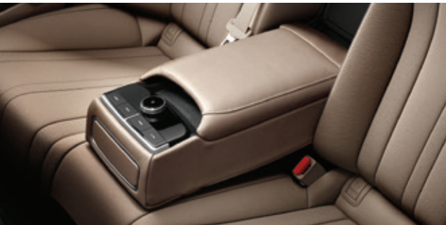
مسند ذراع للمقعد الخلفي