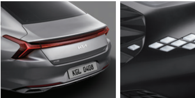
مجموعة مصابيح LED الخلفية