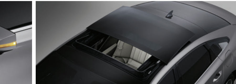
مرايا خارجية مدمج بها مكرر إشارة انعطاف LED جانبية