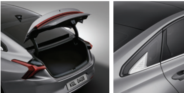
صندوق تخزين كهربائي مزود بوسيلة أمان