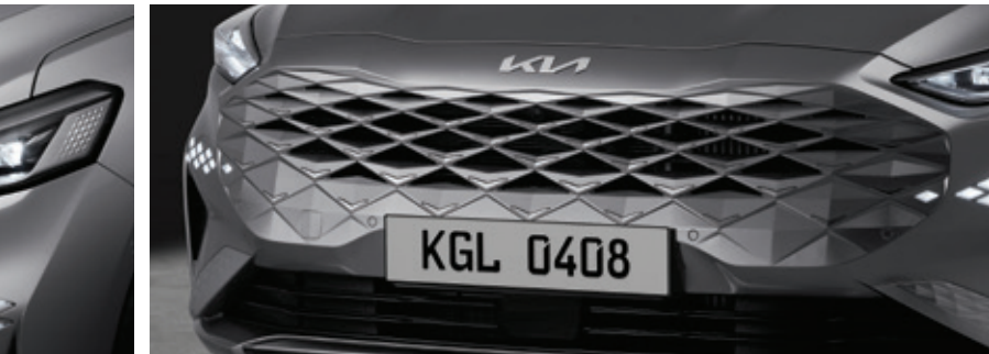
مصابيح LED أمامية