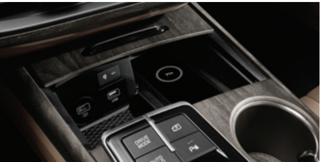
قاعدة شحن لاسلكي