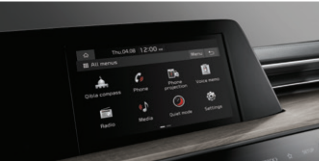
شاشة عرض صوتي مقاس 8 بوصات