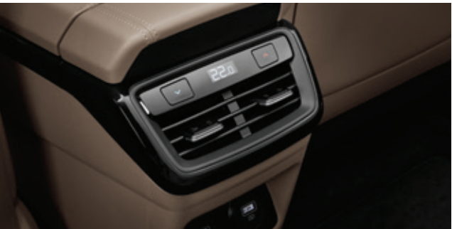
نظام تحكم في المناخ ثلاثي المناطق (نظام تحكم في مناخ المقعد الخلفي)