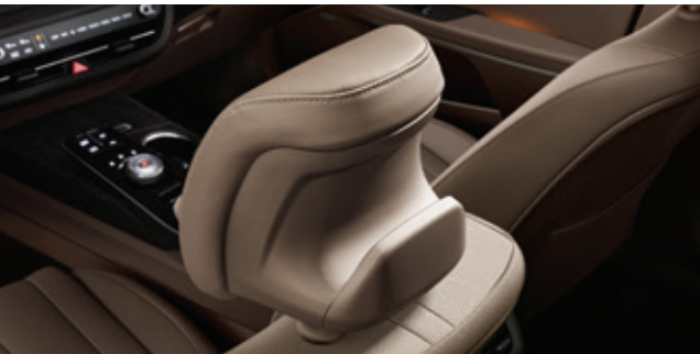
مسند رأس مزود بخطاف تعليق الحقائب