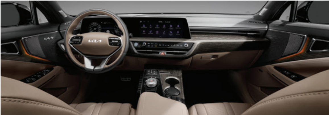
بني توفي بدرجتين