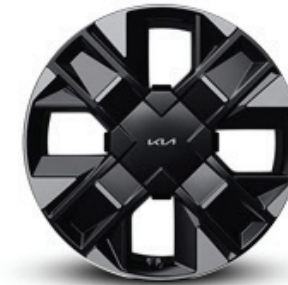
Rin de aluminio de 19" (SXL | SXL HALE NAVY)