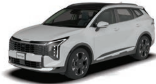
Snow White Pearl