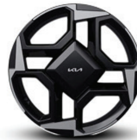
Rin de aluminio de 18" (EX | EX PACK)