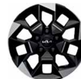
Rin de aluminio de 16" LX, EX, SX