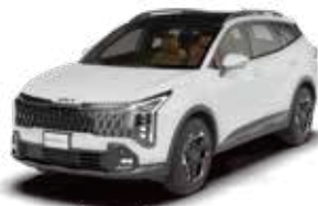
Snow White Pearl