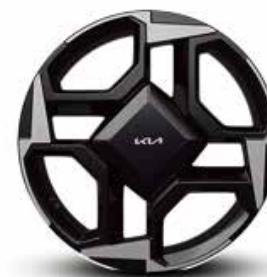
Rin de aluminio de 18" bitono EX PACK