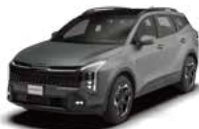
Shadow Matt Gray