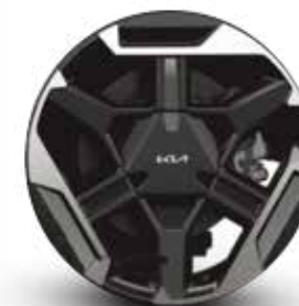
Rin de aluminio de 18" bitono X-Line, X-Line Terracota Brown