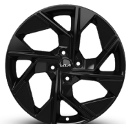
Rin de aluminio de 17"

Kia Finance | MyKia+ Descarga la App MyKia+ disponible para iOS y Android | Kia Assistance | Contact Center: (55) 4780 0542