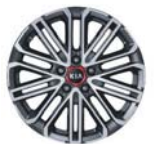
18인치 알로이 휠(GT전용)