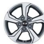
16인치 알로이 휠