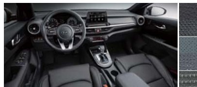
블랙 인테리어 (가죽 / 인조가죽 / 직물)