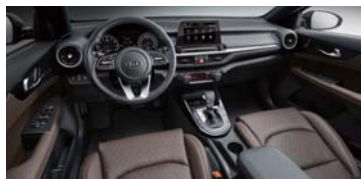
브라운 인테리어 (가죽)