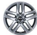
17인치 알로이 휠