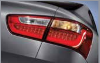
LED 리어 콤비네이션 램프