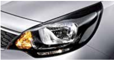
일반형 헤드램프 (세단)