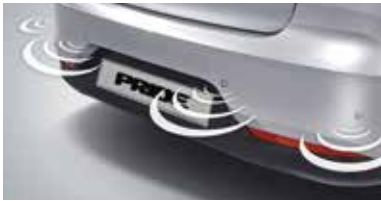
후방 주차 보조 시스템*