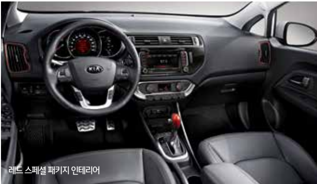
레드 스페셜 패키지 인테리어