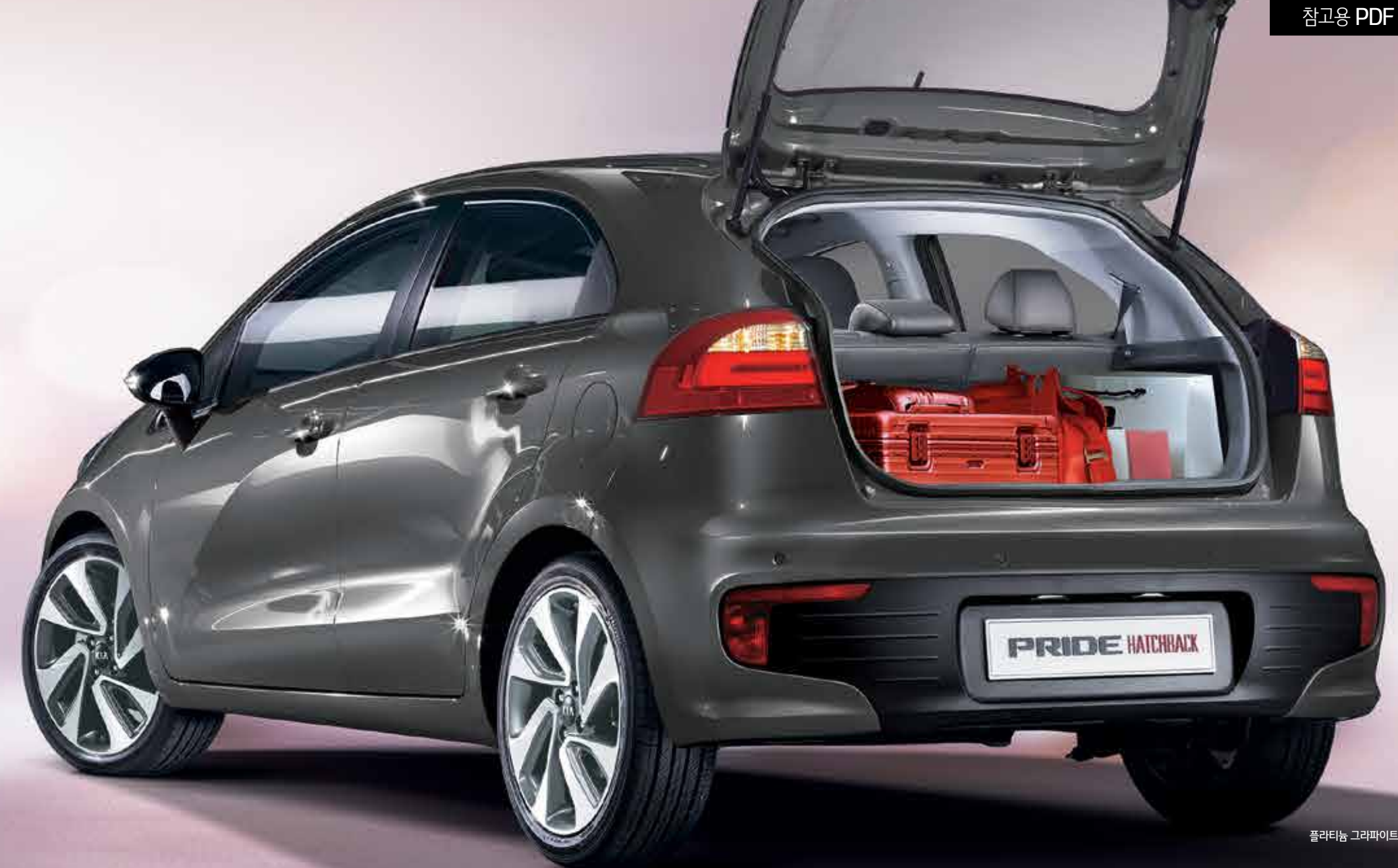
플라티늄 그라피이트 (ABT)