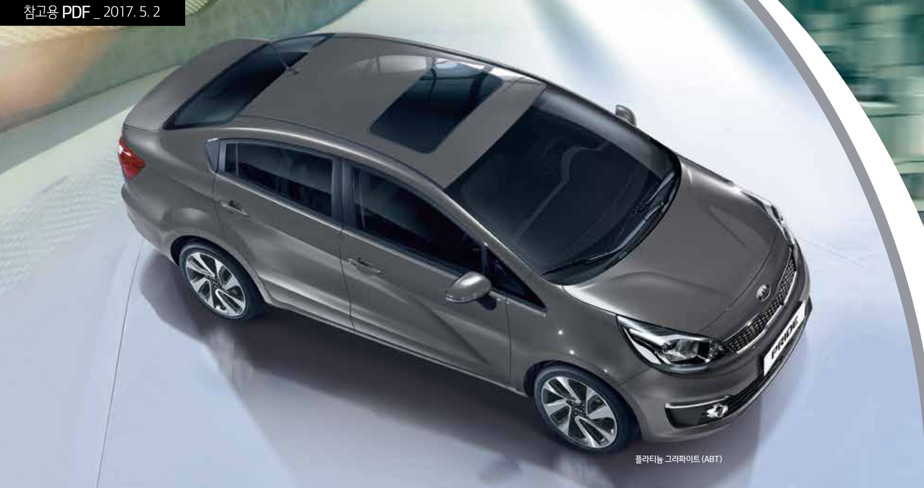
플라티늄 그라파이트 (ABT)