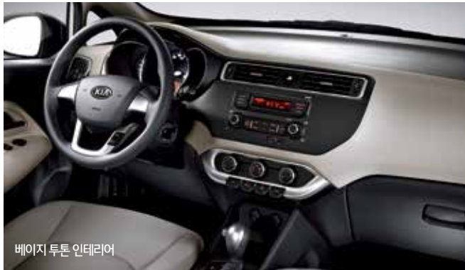
베이지 투톤 인테리어