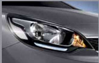
LED 포지션 램프