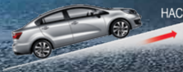
은빛 실버 (3D)

언덕길 정차 후 출발 시 브레이크 제어를 통해 차량이 뒤로 밀리는 것을 일시적으로 방지해 드립니다.