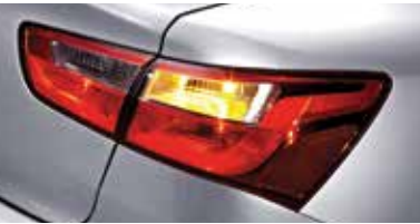
일반형 리어 콤비네이션 램프 (세단)