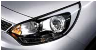
일반형 헤드램프 (해치백)