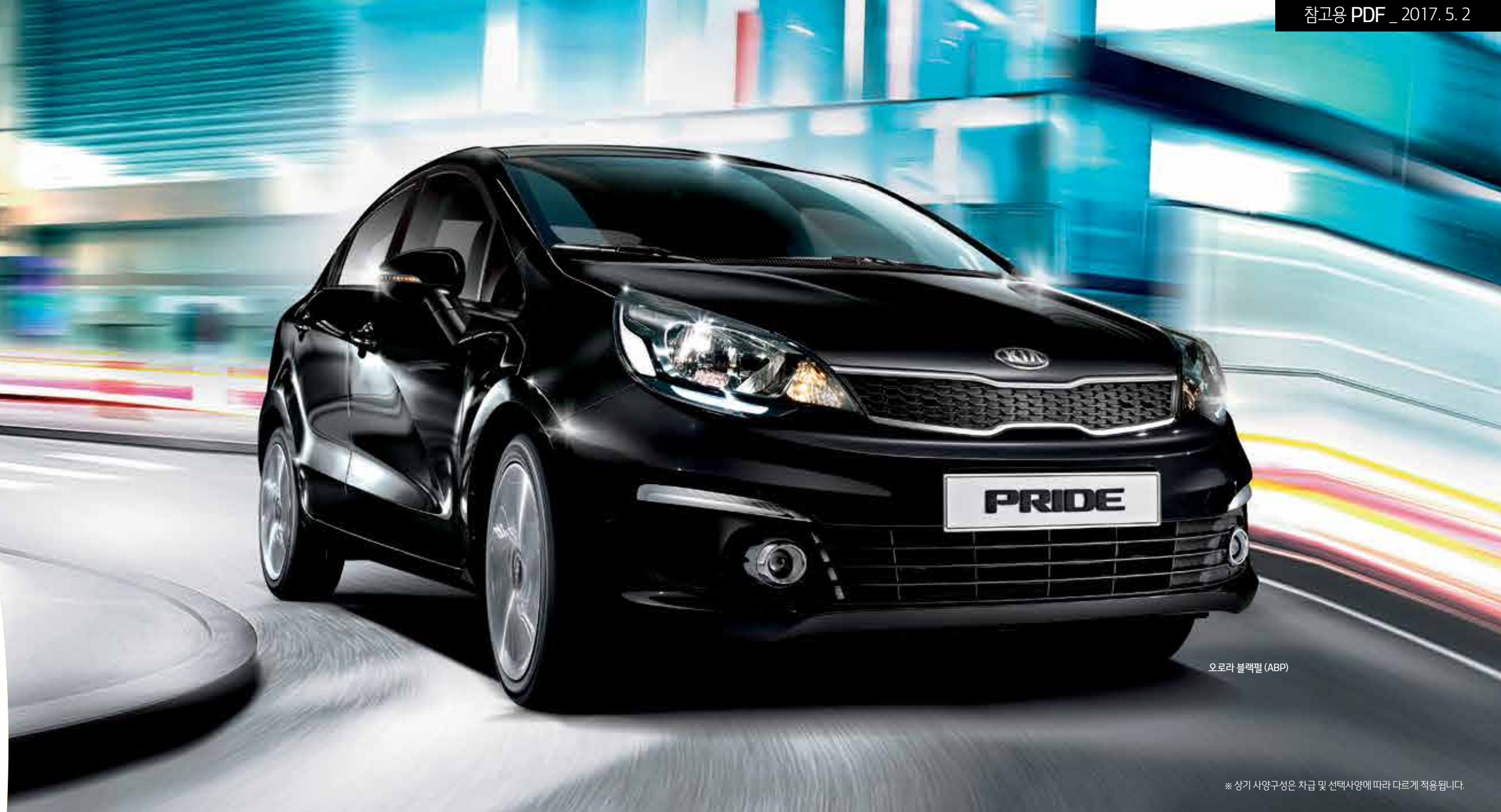
오로라 블랙필 (ABP)