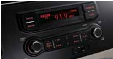
컴팩트 오디오 (MP3 재생)