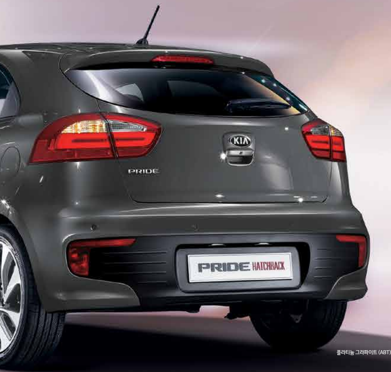
플라티늄 그라파이트 (ABT)