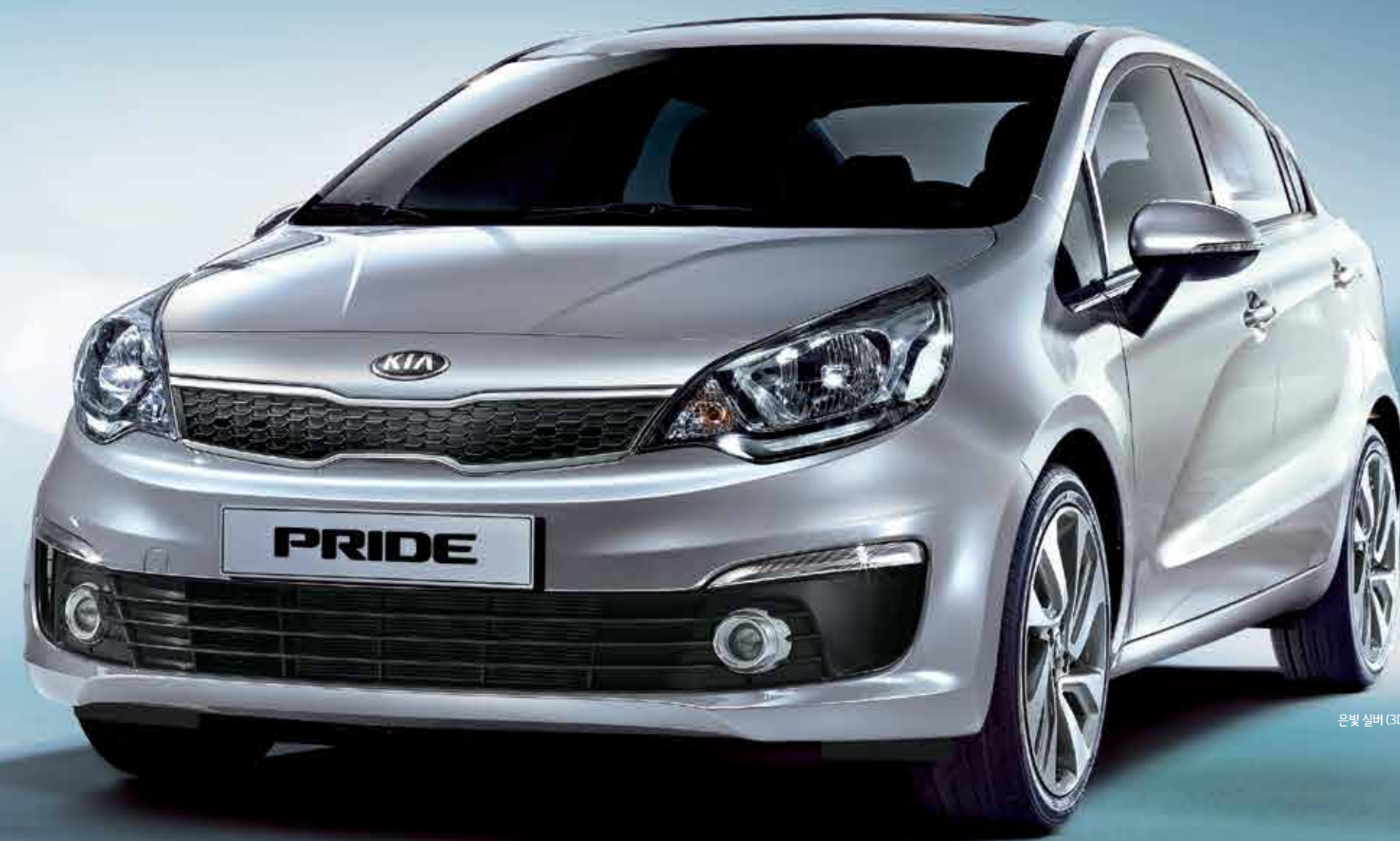
은빛 실버 (3D)