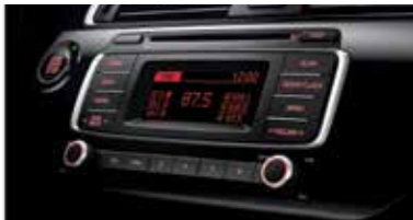
CDP 오디오 (MP3 재생)