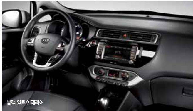
블랙 원톤 인테리어