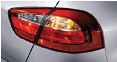
일반형 리어 콤비네이션 램프 (해치백)