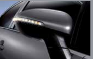
LED 리피터 일체형 아웃사이드 미러