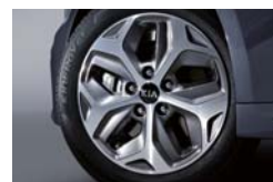
16인치 에어로다이나믹 알로이 휠