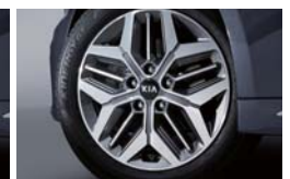
17인치 에어로다이나믹 알로이 휠