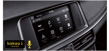
스마트 내비게이션 UVO 3.0 (무료기간 5년) / 카카오톡 (서버형 음성인식)