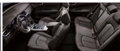
브라운 원톤 인테리어