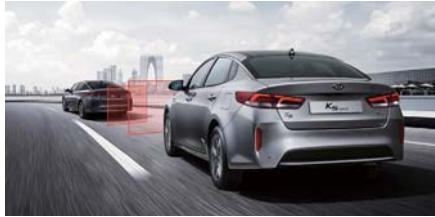
고속도로 주행 보조 (HDA)