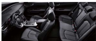
블랙 원톤 인테리어