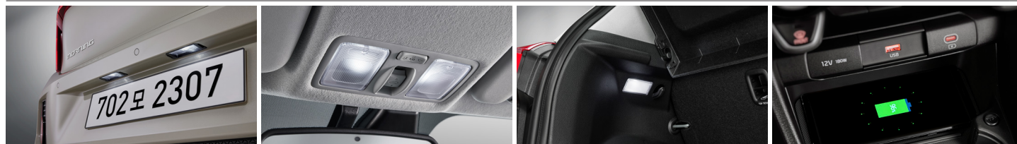
LED 번호판 램프