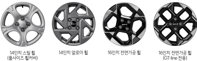
14인치 스틸 휠 (폴사이즈 휠커버)