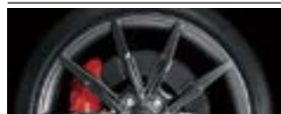
※ 19인치 휠 이미지는 퍼포먼스(플러스) 선택품목 적용 이미지임