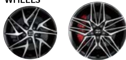
18인치 전면가공휠 19인치 전면가공휠 ※ 19인치 휠 이미지는 퍼포먼스(플러스) 선택품목 적용 이미지임