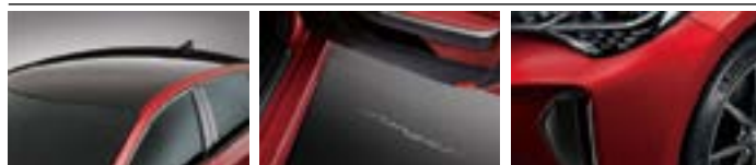
콘솔 암레스트 도어스팟 램프 차량 보호 필름