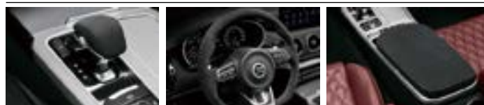
변속기 노브 스티어링 휠 콘솔 암레스트