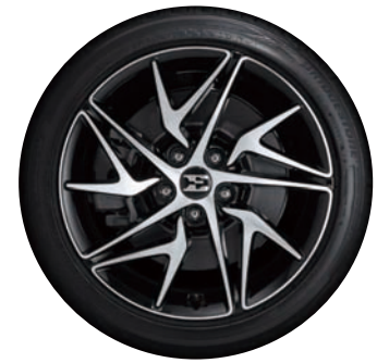
18인치 전면가공 휠