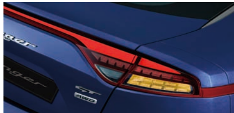
LED 리어 콤비네이션램프 & 브레이크 램프