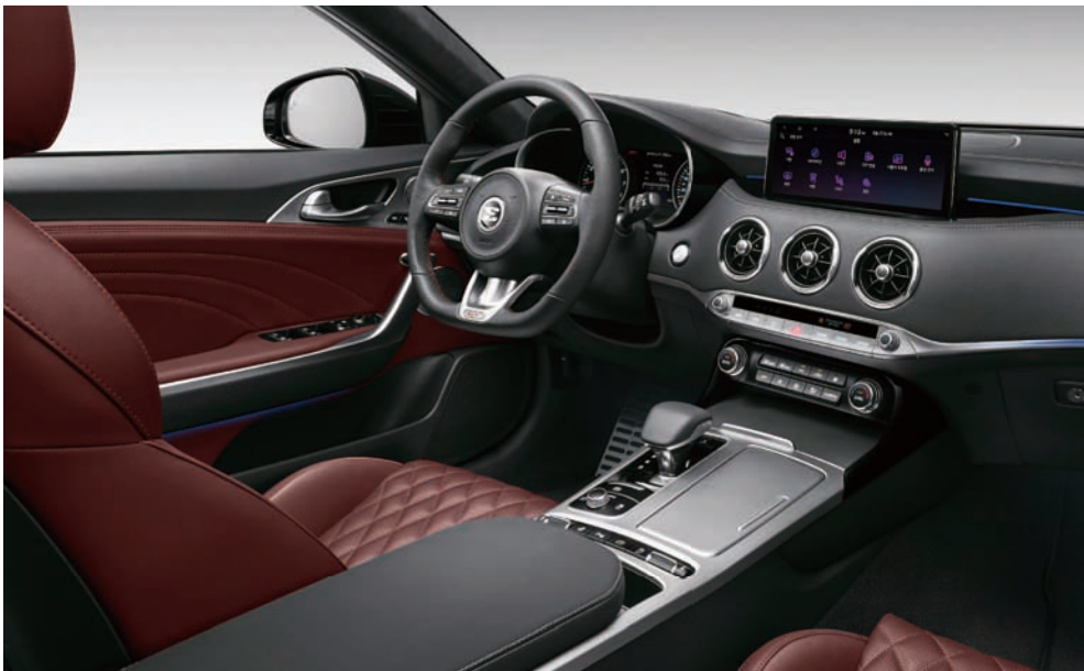
다크 레드 인테리어 (퀵팅 나파가죽)