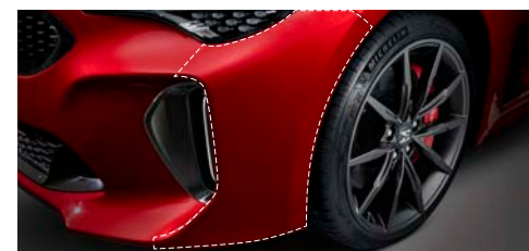
차량 보호 필름* 프론트/리어 범퍼 사이드, 도어 엣지, 도어 캡, 도어 스텝, 주유구 도어 부착