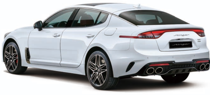
3.3 가솔린 터보