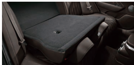
뒷좌석 6:4 폴딩시트