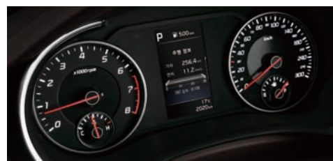
슈퍼비전 클러스터 (4.2인치 칼라 TFT LCD)