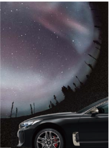
오로라 블랙 펄 (ABP)