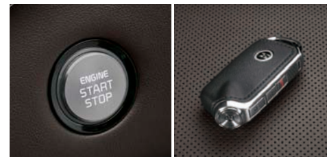
버튼시동 스마트키 시스템