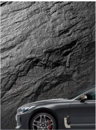
판테라 메탈 (P2M)