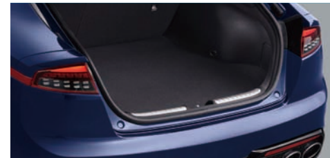
메탈 트랜스버스 트림