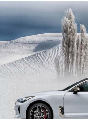
스노우 화이트 펄 (SWP)