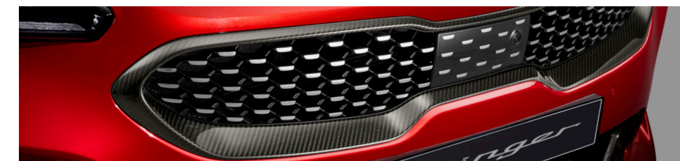
라디에이터 그릴 몰딩