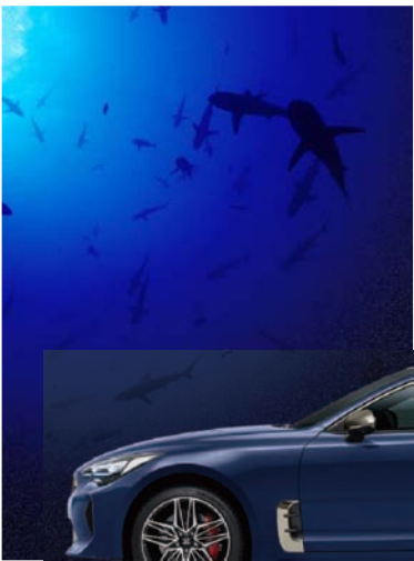
딥크로마 블루 (D9B)