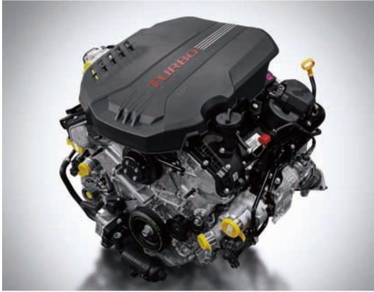
3.3 T-GDI 가솔린 엔진