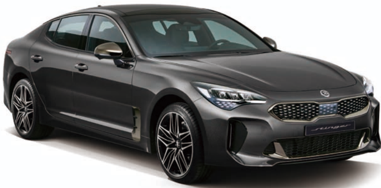
2.5 가솔린 터보