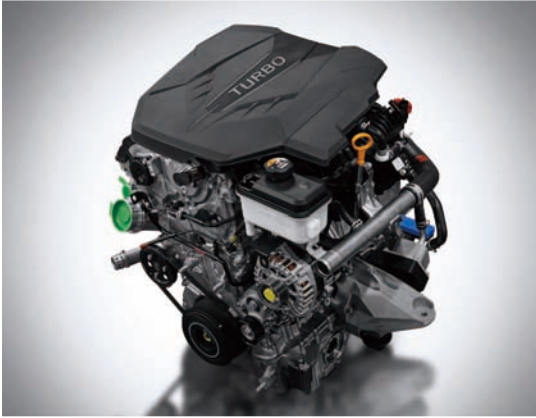
스마트스트림 G2.5 T-GDI 엔진

300마력 이상을 기본으로 탑재한 스마트스트림 G2.5 T-GDI 엔진, 3.3 T-GDI 가솔린 엔진으로 파워풀하고 과감한 주행성능을 제공합니다.