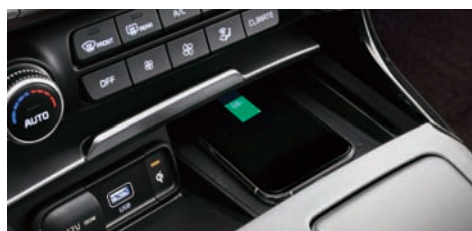
스마트폰 무선충전 시스템