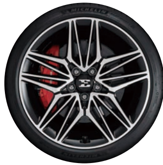
19인치 전면가공 휠 ※ 19인치 휠 이미지는 퍼포먼스(플러스) 선택품목 적용 이미지임