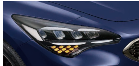
LED 헤드램프 & DRL