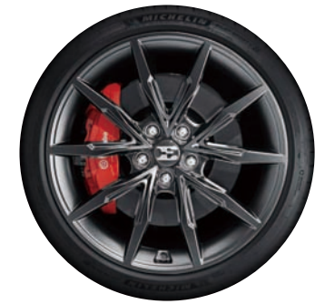
19인치 디자인 휠 ※ 19인치 휠 이미지는 퍼포먼스(플러스) 선택품목 적용 이미지임