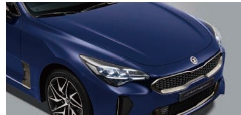
일반 후드 (가니쉬 미적용)