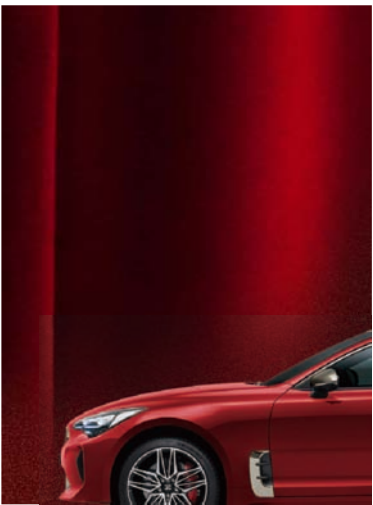
하이크로마 레드 (H4R)