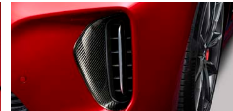
프론트 범퍼 에어 커튼