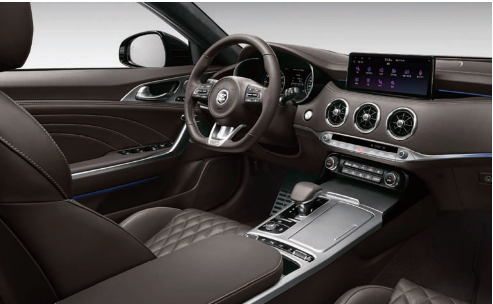
브라운 인테리어 (퀵팅 나파가죽)