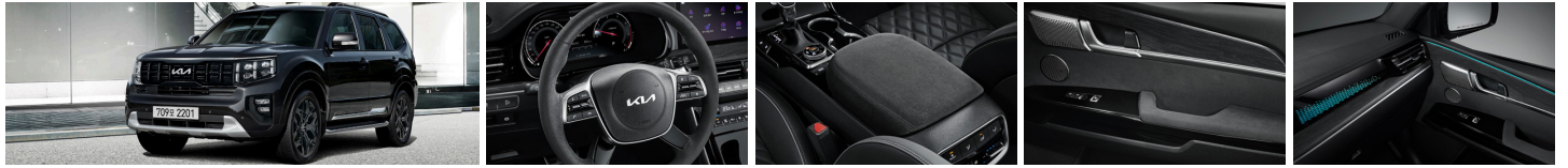
그래비티 전용 외장 디자인 (20인치 블랙 알로이 휠 등)