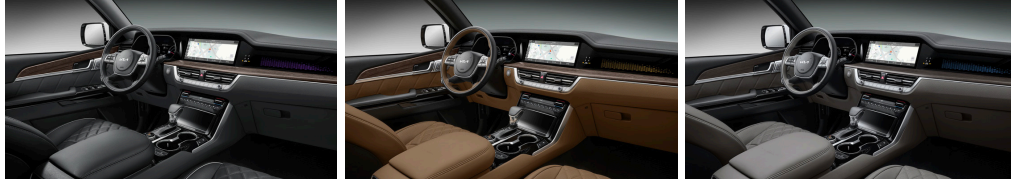
블랙 인테리어(퀵팅 나파가죽/가죽)