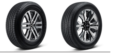
18인치 전면가공 휠