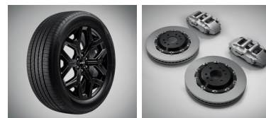
20인치 블랙 알로이 휠