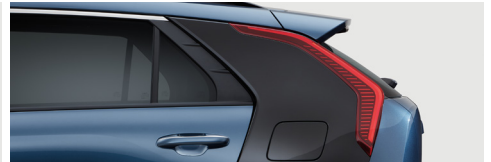
미네랄 블루(C필러 - 오로라 블랙 펄)