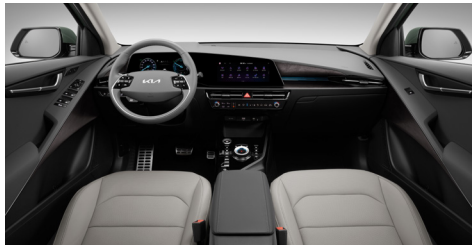
미디움 그레이 인테리어