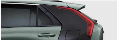
시티스케이프 그린(C필러 - 오로라 블랙 펄)