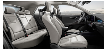
가죽시트(미디움 그레이 인테리어)