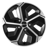
16인치 전면가공 휠