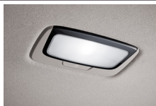
LED 룸 램프