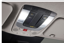
LED 오버헤드콘솔 램프