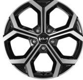
18인치 전면가공 휠