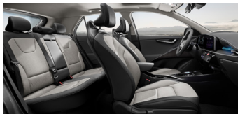
바이오 인조가죽시트(미디움 그레이 인테리어)