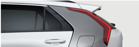
스노우 화이트 펄(C필러 - 스틸 그레이)