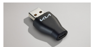
A to USB-C 변환 젠더*