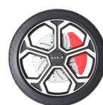
휠 디자인 디퓨저