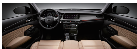
새들 브라운 인테리어