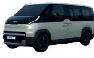
Mint Ivory (metalický lak)