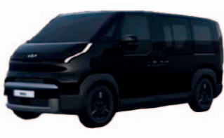
Aurora Black Pearl (perleťový lak)