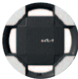
16-palcové disky kolies z ľahkých zliatin (pneumatiky 215/65 R16) Plus / Elite