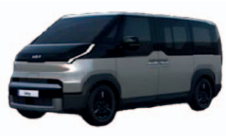
Steel Gray (metalický lak)