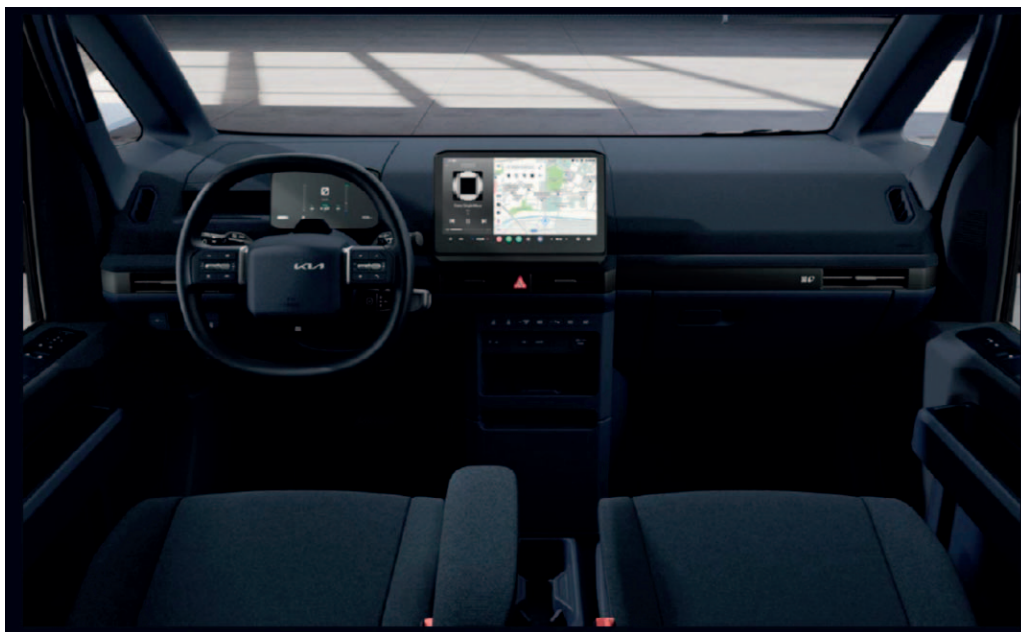
Tmavomodrý interiér (Essential / Plus / Elite)