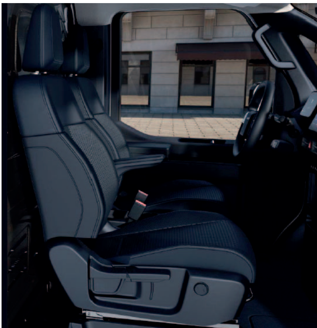
Tmavomodrý interiér v kombinácii látky / umelá koža (Plus + Style pack / Elite + Seat pack)