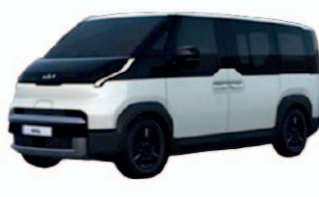
Snow White Pearl (perleťový lak)