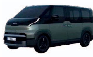
Cityscape Green (metalický lak)

Obrázky sú ilustračné a zobrazujú model PV5 Passenger.