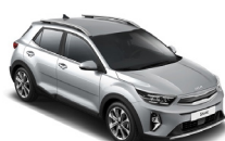
Sparkling Silver (KCS) metallic