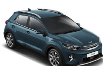
Smoke Blue (EU3) metallic