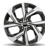
17 " aluminiumfälg (GT Line)