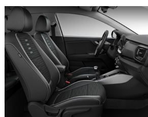
Svart interiör med svart delläderklädsel (konstläder) (GT Line)