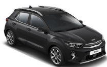
Aurora Black Pearl (ABP) metallic (pearleffekt)