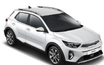
Clear White (UD) solid