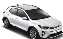
Snow White (SWP) metallic (pearleffekt)