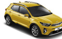
Honey Bee (B2Y) metallic

Kia Sweden AB Kanalvägen 10A 194 61 Upplands Väsby Sverige Tfn: 08 - 400 443 00 www.kia.com