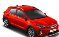
Signal Red (BEG) metallic