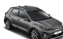
Astro Grey (M7G) metallic