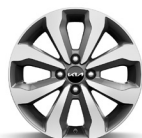
16 " aluminiumfälg (Advance)