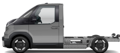
Steel Gray [KLG] metallic