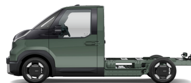
Cityscape Green (CGE) metallic