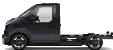
Aurora Black Pearl [ABP] metallic