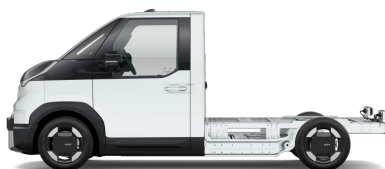
Snow White Pearl [SWP] metallic (pearleffekt)