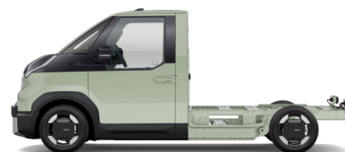
Soft Mint [SML] metallic