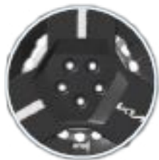
16" Plåtfälg med hel hjulsida 215/65 R 16