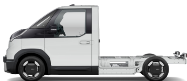
Clear White [UD] solid