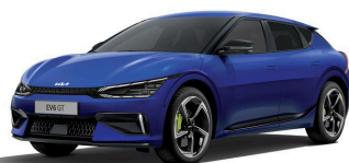
Yacht Blue (DU3) metallic