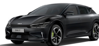
Aurora Black Pearl (ABP) metallic (pearleffekt)