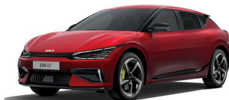
Runway Red (CR5) metallic