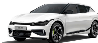
Snow White Pearl (SWP) metallic (pearleffekt)