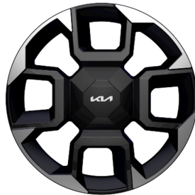
EV5 GT Line 19" aluminiumfälgar 235/55 R 19