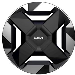
EV5 & EV5 Plus 18" aluminiumfälgar 235/60 R 18