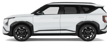
Snow White Pearl [SWP] metallic (pearleffekt)