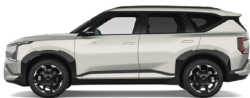
Ivory Silver [ISG] metallic