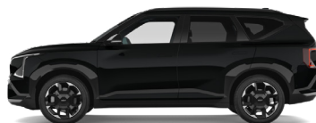
Fusion Black [FSB] metallic (pearleffekt)