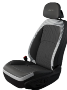
EV5 GT Line Konstläder