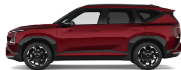
Magma Red [OVR] metallic