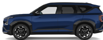
Dark Ocean Blue [BU3] metallic