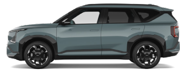
Iceberg Green [IEG] metallic