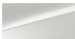
Deluxe White (HW2)