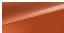
Orange Fusion (RNG) nieдоступny dla GT-Line