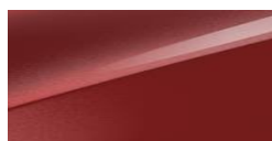
Infra Red (AA9)