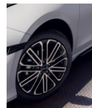
Felgi aluminiowe GT-Line z oponami w rozmiarze 225/40/R18