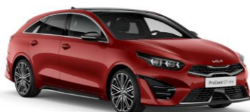
Infra Red (AA9)