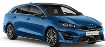
Blue Flame (B3L)