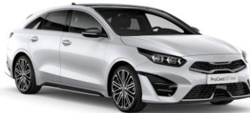
Deluxe White (HW2)