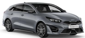
Lunar Silver (CSS)