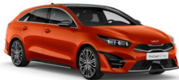
Orange Fusion (RNG) dostępny tylko dla samochodów ze stoku