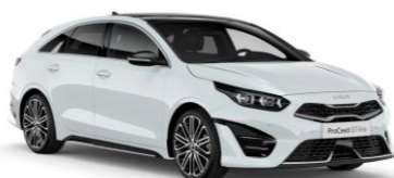
Cassa White (WD) bez dopłaty