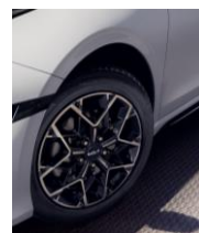
Felgi aluminiowe GT-Line z oponami w rozmiarze 225/45/R17