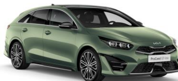
Experience Green (EXG)