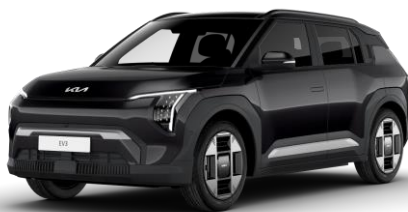
Aurora Black (ABP) metalizowany