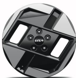
17" felgi aluminiowe Air i Earth