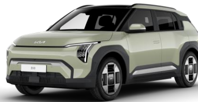
Aventurine Green (AG3) metalizowany