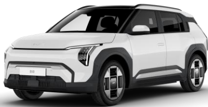
Clear White (UD) pastelowy