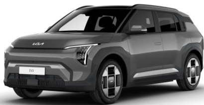
Shale Grey (EBD) metalizowany