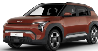
Terra Cotta (TCT) metalizowany bez dopłaty