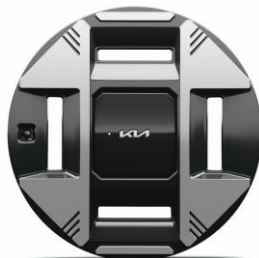
19" felgi aluminiowe Business Line