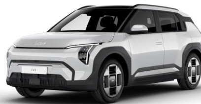
Snow White (SWP) metalizowany