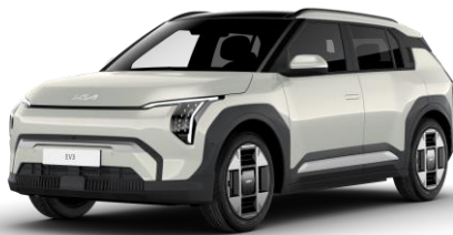
Ivory Silver (ISG) metalizowany