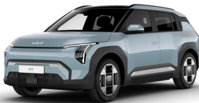
Frost Blue (EBB) pastelowy