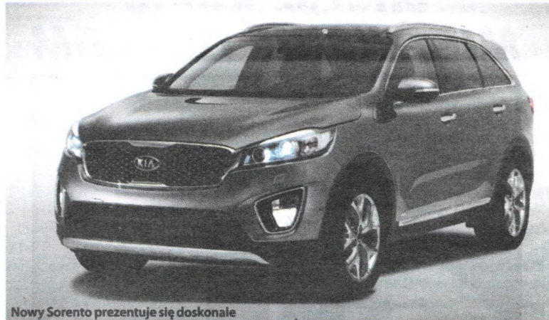
Nowy Sorento prezentuje się doskonale

Jak salon to robi, że osiąga takie wyniki? – Kupiliśmy nieruchomości w 2014 roku. Remontujemy, inwestujemy, żeby standard obsługi klientów odpowiadał czasom, w jakich żyjemy. Nastawiamy się nie tylko na sprzedaż i pieniądze, ale staramy się skupiać