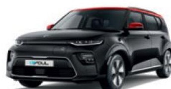
Cherry Black + Inferno Red (AH5)