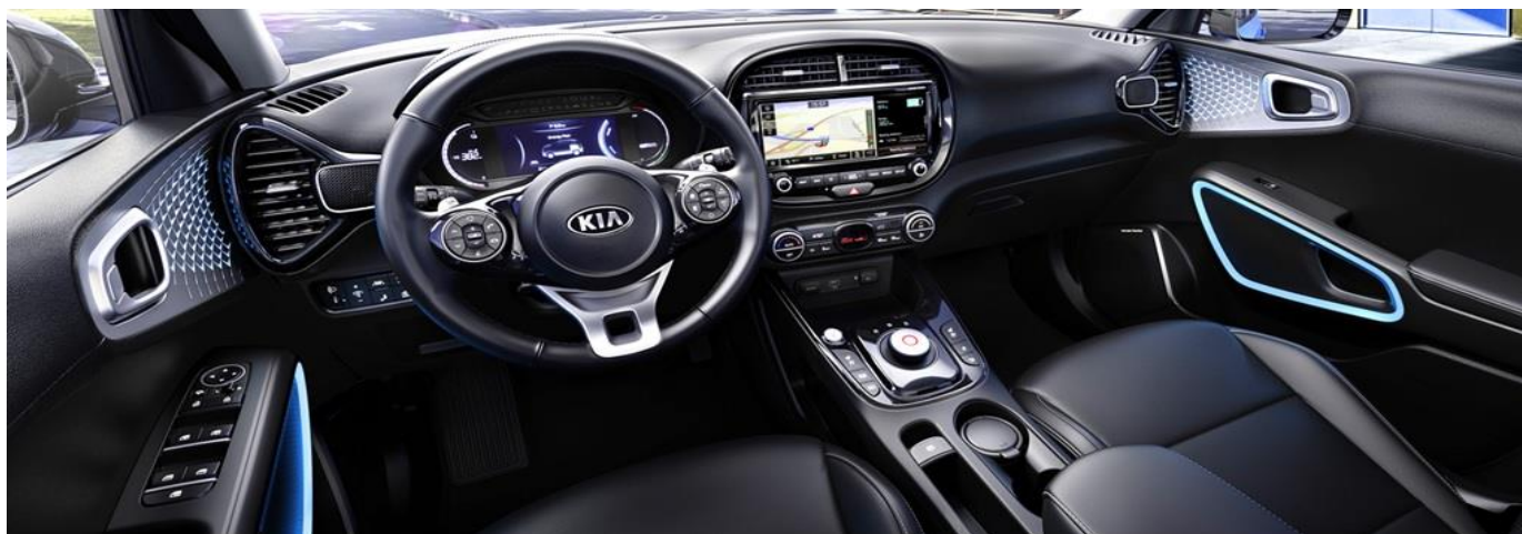
Bildet viser interiørfarge sort. Utstyr kan avvike

Priser og spesifikasjoner kan endres uten varsel. Det tas forbehold om trykkfeil