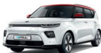
Clear White + Inferno Red (AH1)