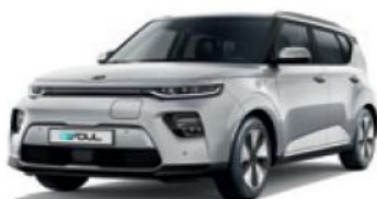
Sparkling Silver (KCS)