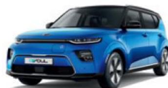
Neptune Blue + Cherry Black (SE2)