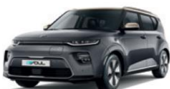
Gravity Grey + Platinum Gold (SE1)