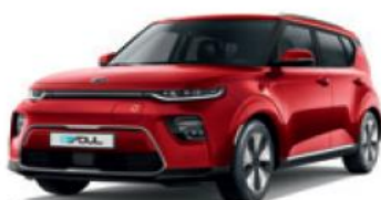
Inferno Red (AJR)