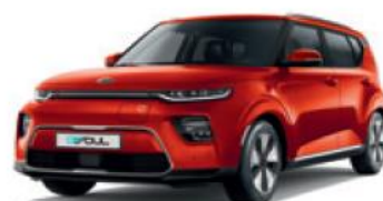
Mars Orange (M3R)