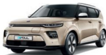
Platinum Gold + Clear White (SE4)