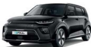
Cherry Black (9H)