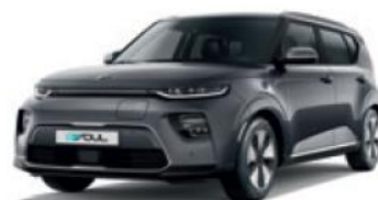
Gravity Grey (KDG)