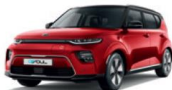
Inferno Red + Cherry Black (AH4)