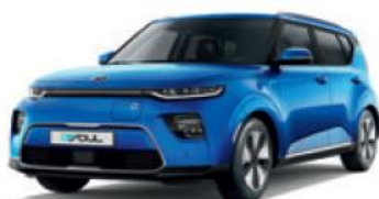
Neptune Blue (B3A)