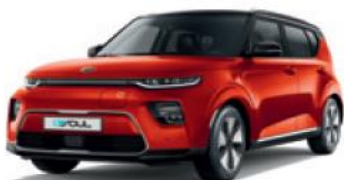
Mars Orange + Cherry Black (SE3)