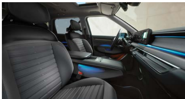
Vegan lederen bekleding - donkergrijs met zwart

Stoelzitting in donkergrijs met gewatteerde horizontale afwerking, het bovenste gedeelte van de rugleuning en hoofdsteun afgewerkt in het zwart. Dashboard met duurzame materialen en in donkergrijze tinten.