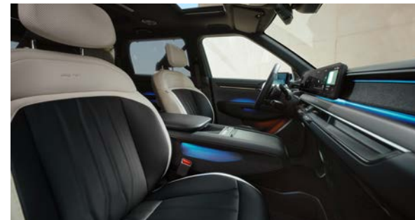
Vegan lederen bekleding - GT-Line zwart met lichtgrijs

Stoelzitting in zwart met GT-Line logo's, het bovenste gedeelte van de rugleuning en hoofdsteun afgewerkt in lichtgrijs. Dashboard met duurzame materialen en in donkergrijze tinten.