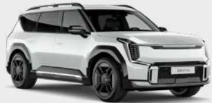
Snow White Pearl Kleurcode: SWP