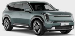
Iceberg Green Kleurcode: IEG