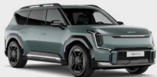
Iceberg Green Kleurcode: IEG