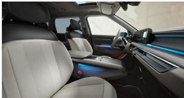
Vegan lederen bekleding - lichtgrijs met donkergrijs

Stoelzitting in lichtgrijs met subtiel reliëf, het bovenste gedeelte van de rugleuning en hoofdsteun afgewerkt in het donkergrijs. Dashboard met duurzame materialen en in lichtgrijze tinten.