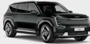
Aurora Black Pearl Kleurcode: ABP