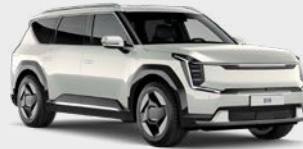
Ivory Silver Glossy Kleurcode: ISG