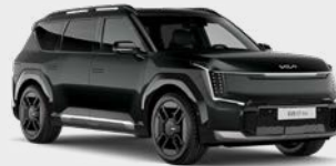
Aurora Black Pearl Kleurcode: ABP