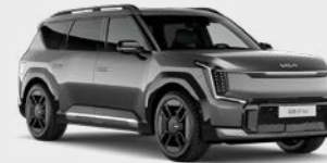
Pebble Grey Kleurcode: DFG