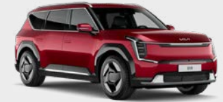
Flare Red Kleurcode: C7R Standaard (gratis) kleur