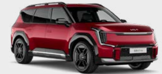
Flare Red Kleurcode: C7R