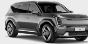
Pebble Grey Kleurcode: DFG