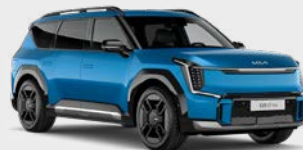
Ocean Blue Glossy Kleurcode: OBG