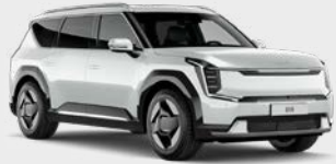
Snow White Pearl Kleurcode: SWP

Beschikbaar op Air / Plus / Launch Edition