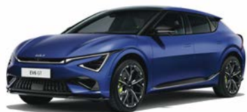
Yacht Blue Matte Kleurcode: DUM