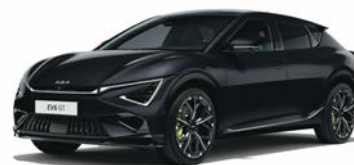
Aurora Black Pearl Kleurcode: ABP