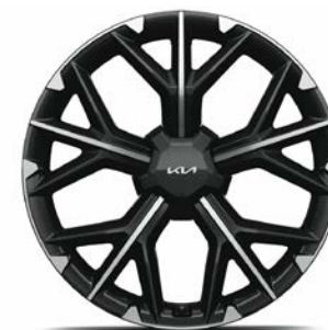
21" lichtmetalen velgen (255/40 R21) Exclusief voor EV6 GT