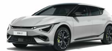
Wolf Grey Kleurcode: C7S