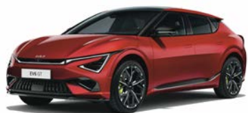
Runway Red Kleurcode: CR5