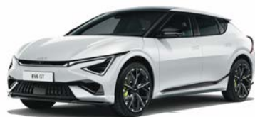
Snow White Pearl Kleurcode: SWP