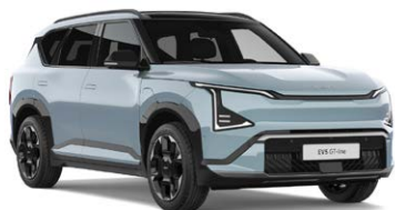
Frost Blue Kleurcode: EBB