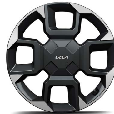
19" lichtmetalen velgen (235/55 R19) Standaard voor GT-Line, GT-PlusLine en GT-Line Business Edition uitvoeringen