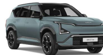
Iceberg Green Matte* Kleurcode: IEB