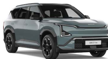
Iceberg Green Kleurcode: IEG