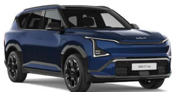
Dark Ocean Blue Kleurcode: BU3