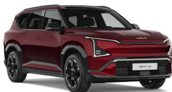
Magma Red Kleurcode: OVR