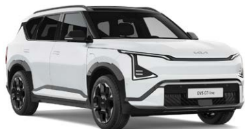
Snow White Pearl Kleurcode: SWP