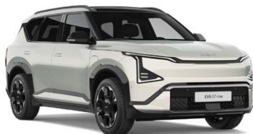
Ivory Silver Kleurcode: ISG