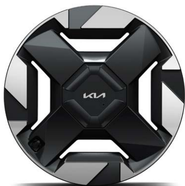
18" lichtmetalen velgen (235/60 R18) Standaard voor Air en Plus uitvoeringen