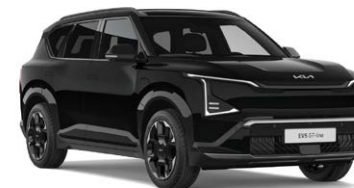
Fusion Black Kleurcode: FSB