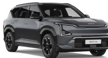
Gravity Gray Kleurcode: KDG