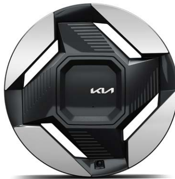
19" lichtmetalen velgen (235/55 R19) Standaard voor Plus Advanced uitvoeringen