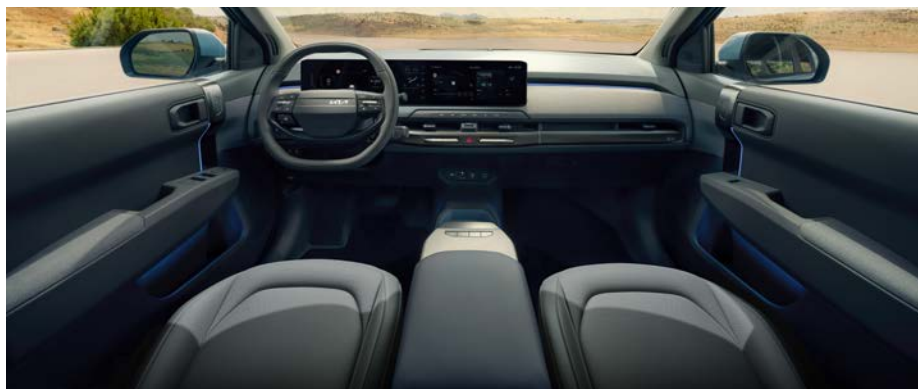
Vegan lederen bekleding - two-tone grijs

Vegan lederen stoelbekleding in een combinatie van lichtgrijs en donkergrijs. De middenconsole en de stoelbekleding beschikken over lichtblauwe accenten. Het dashboard, de deurpanelen en -armsteunen zijn voorzien van stoffen bekleding.