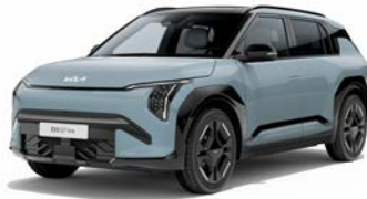
Frost Blue (solid) Kleurcode: EBB