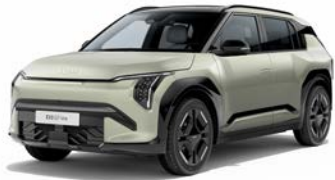
Aventurine Green Kleurcode: AG3