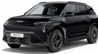
Aurora Black Pearl Kleurcode: ABP