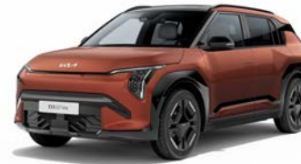
Terra Cotta Kleurcode: TCT