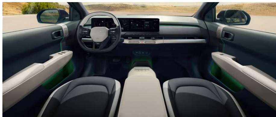
Vegan lederen bekleding - two-tone gebroken wit/grijs

Vegan lederen GT-Line stoelbekleding in een combinatie van gebroken wit en donkergrijs. Armsteunen in de deuren zijn voorzien van vegan leder en het dashboard en de deurpanelen zijn voorzien van stoffen bekleding. De hoofdsteunen zijn voorzien van mesh stof en de achterkant van de voorstoelen is aan de bovenzijde voorzien van een stoffen afwerking.