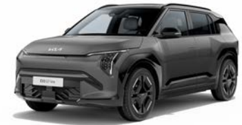
Shale Grey Kleurcode: EBD