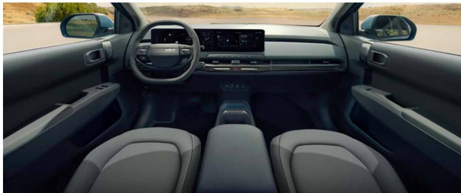
Stoffen bekleding - two-tone grijs

Stoffen stoelbekleding in een combinatie van lichtgrijs en donkergrijs. De middenconsole en de stoelbekleding beschikken over lichtblauwe accenten.