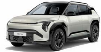
Ivory Silver Glossy Kleurcode: ISG