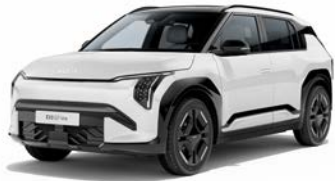
Clear White (solid) Kleurcode: UD

Kleuren beschikbaar voor alle uitvoeringen