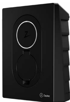
Asphalt Black CPOHWZGFC