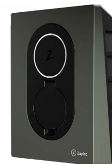
Moss Green CPOHWZGFCMS