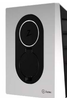
Cool White CPOHWZGFCCW