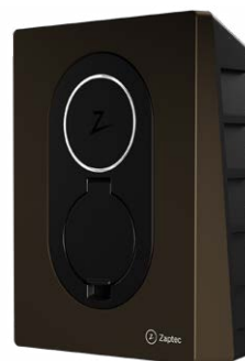
Wood Brown CPOHWZGFCWB