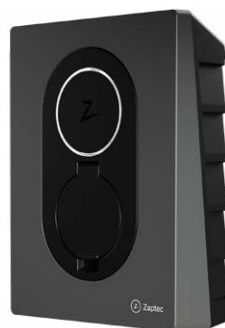
Rock Grey CPOHWZGFCRG