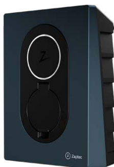
Midnight Blue CPOHWZGFCMB