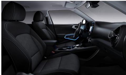
Sedili in tessuto di serie