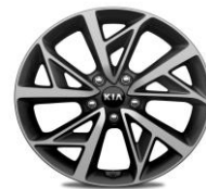
Cerchi in lega da 18" 225/45R18