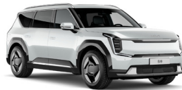
Snow White Pearl (SWP) Prémium Metál