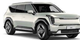
Ivory Silver (ISG) Prémium Metál