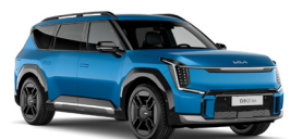
Ocean Blue (OBG) Prémium metál