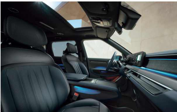
LAUNCH GT-LINE Grafit - Tengeréskék (NJR)