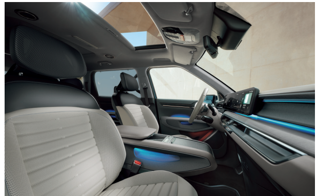
LAUNCH EARTH Grafit - Szignálszürke (EMA)