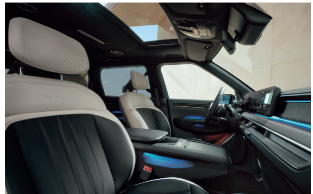
LAUNCH GT-LINE Törtfehér - Fekete (RBQ)