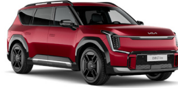
Flare Red (C7R) alapfényezés