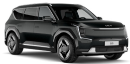
Aurora Black Pearl (ABP) Metál