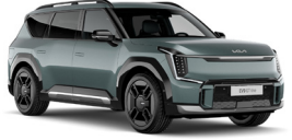
Iceberg Metal (IEG) Metál