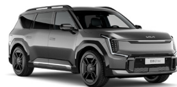
Pebble Gray (DFG) Metál