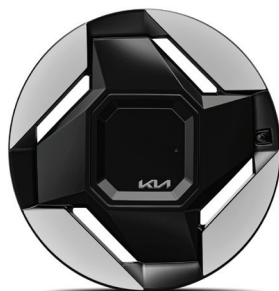
LAUNCH EARTH 19" keréktárcsa