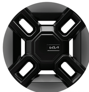
LAUNCH GT-LINE 21" keréktárcsa