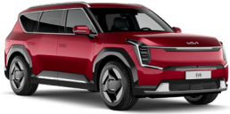
Flare Red (C7R) alapfényezés