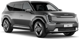
Pebble Gray (DFG) Metál