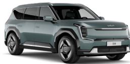
Iceberg Metal (IEG) Metál