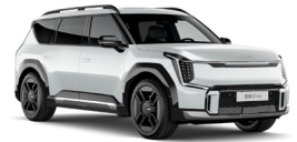
Snow White Pearl (SWP) Prémium Metál